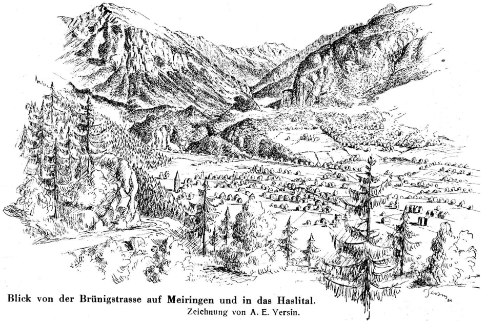
Blick von der Brünigstrasse auf Meiringen und in das Haslital. Zeichnung von A. E. Yersin.

Vorläufig indessen ist Yersin noch ein Sucher seines Stils und ringt er mit der Materie um den geläuterten Ausdruck. Er hat es in der Federzeichnung schon zu einer er-