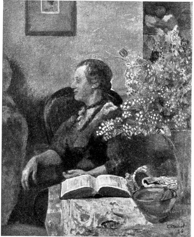
Cuno Amiet: Intérieur mit Frau A.