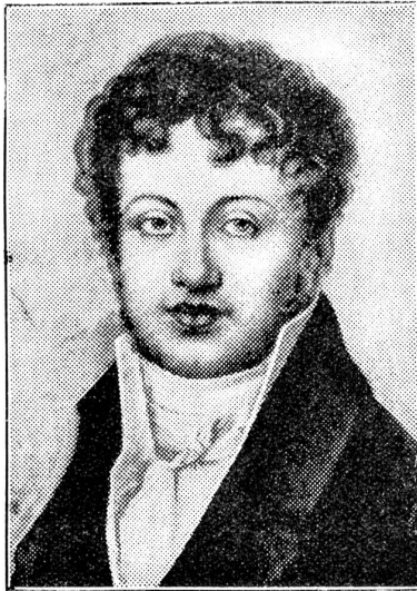
André Marie Ampère.

niedergelegt. Kein Wunder, wenn es Ampère mit einem Schläge berühmt machte, ihm die Berufung als Professor der Physik ans Collège de France eintrug, nachdem er vorher