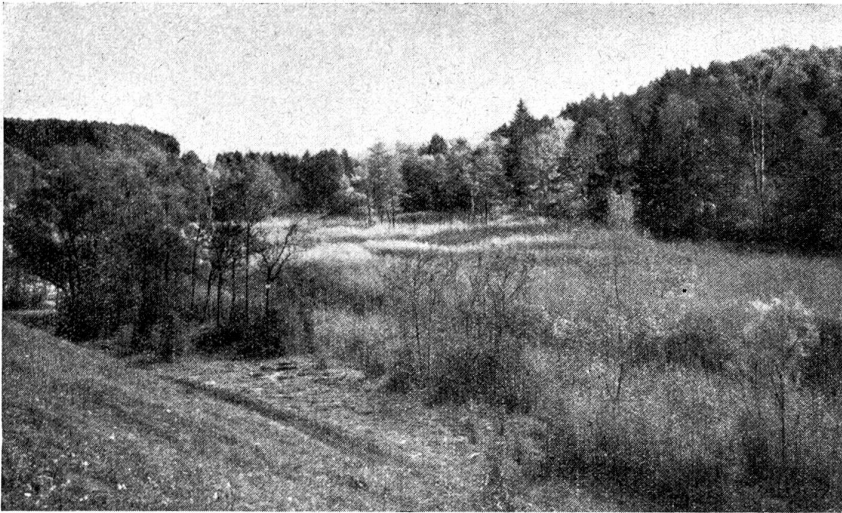
In der Au. Partie aus der Elfenau.

men und Darnachachtung noch ein Marterl der Bayrischen Bergwacht hier anführen, das da lautet: