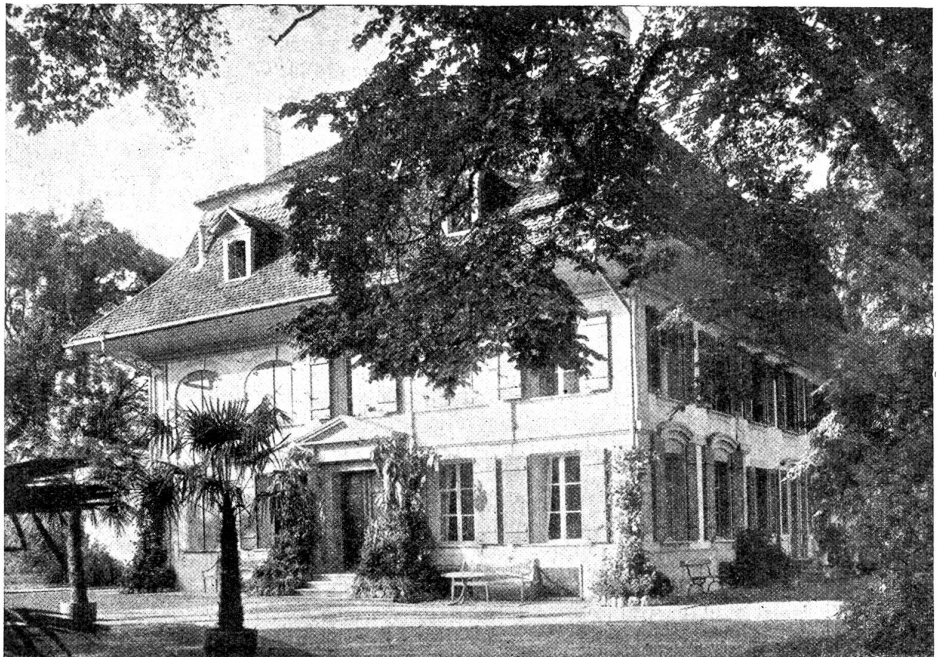
Die „Elfenau“ Ehemaliges Wohnhaus der russischen Grossfürstin Feodorowna.

„Vater, ich möchte lieber nicht mitkommen. Es ist doch so langweilig, in dieser eintönigen Gegend herum zu hum-