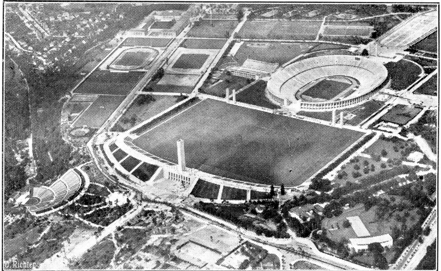
Luftaufnahme des Reichssportfeldes in Berlin.

Nun ist die Aktion gekommen, und man weiß nicht,