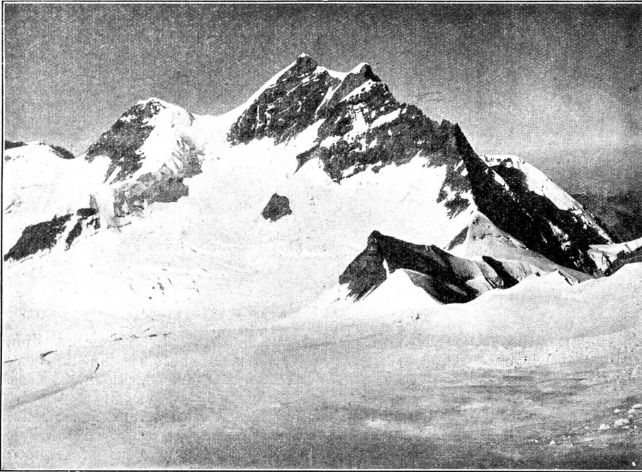
Jungfraugipfel. Links Rottalhorn.