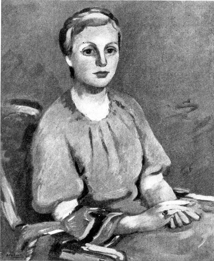
Ernest Hubert, „Portrait“. (Oelgemälde.)

stande war, die Leute neugierig, eifrig und erregt zu machen, es dies war, daß der Ring wiedergefunden und wieder verloren worden war, daß man Ingilbert tot im Walde gefunden hatte, und daß die Olsbyleute jetzt in dem Verdacht standen, sich den Ring angeeignet zu haben, und im Gefängnis saßen. Als die Kirchenbesucher Sonntag nachmittag heimgewandert kamen, konnte man sich kaum so lange gedulden, bis sie die Kirchenkleider abgelegt und einen Bissen genossen hatten, sie mußten gleich von allem erzählen, was ausgesagt, und allem, was eingestanden worden war, und was man wohl glaubte, zu welcher Strafe die Angeklagten verurteilt werden würden.