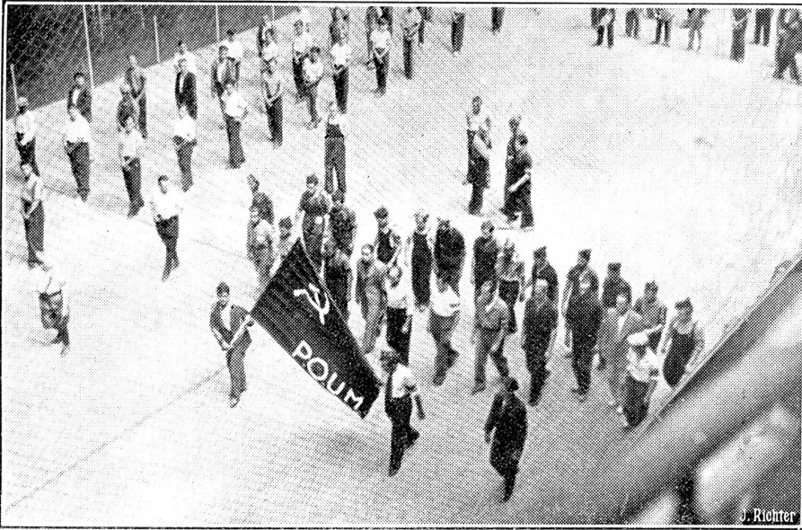
Der spanische Bürgerkrieg. Marschübende Milizgruppen in Barcelona.