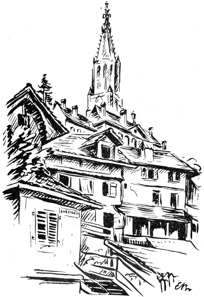
Aufgang zur Fricktreppe zum Münsterplatz.

Nun aber zurück zur Stadtbesichtigung. Ueberqueren wir den Bärenplatz in südlicher Richtung, so gelangen wir zum Bundesplatz und den ausgedehnten Verwaltungen der Eidgenossenschaft, dem Bundeshaus und Parlament. Der Mittelbau mit dem Nationalratssaal und den andern Sitzungszimmern unserer Regierung, stellt einen recht repräsentablen Bau, aber ohne einheitlichen Stil, dar. Die Besucher werden unentgeltlich durch die Räumlichkeiten geführt und erhalten so Gelegenheit, neben andern zwei gewaltige Wandbilder zu sehen: das eine, von Giron, den Vierwaldstättersee darstellend, das andere, von Welki und Balmer, „Die Landsgemeinde“. Der Besucher des Bundeshauses sollte nicht veräumen, von der Bundesterrasse aus einen Blick auf das Aaretal und die Berner Alpen zu werfen, sofern die letzteren