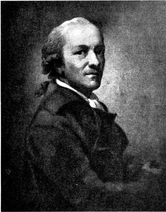
Anton Graff: Selbstbildnis des Künstlers im Alter von 61 Jahren. (Kunstsammlung Winterthur.)

von der neuen Maschine, die der Vater vorsorglich während des Festes aufgestellt hatte, damit, wenn der Werktag anbräche, alles zum Geldverdienen bereit wäre. Adeli brach auf einem Stuhl zusammen und starrte auf die beiden Mäxtergeräte, die hier und dort gespenstig, leicht vom Mondlicht gestreift, an den Wänden standen. Sie erschienen ihr, je länger sie hinschaute, immer unheilvoller, wie zwei besessene, lauernde, boshafte Wesen, zwei Teufel, die ihre Spinnenfinger nach ihr ausstreckten, von links und von rechts, um sie für immer festzuhalten und zu zerkrümmen. In ihrer Aufregung gab sie der Furcht immer mehr Macht über sich, kaum wagte sie sich auf ihrem Stuhl zu rühren. Die beiden Ungeheuer aber begannen zu wachsen, regten sich und krochen näher heran, ihre Finger wurden immer länger und spitzer, ihre Leiber immer gespenstiger und gedehnter. Die Spulen glöhten im Mondlicht wie zwanzig Augen. Da sprang Adeli auf und zurück ins Freie, es lief ihr kalt den Rücken hinauf, ihre Haare sträubten sich, sie fühlte ein jedes wie eine eisige Nadelspitze.