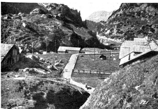
Obenher Steingletscher. Blick vom Hotel Steingletscher talauwärts gegen die „Höll“.

Es ist zweifellos so: In Europa reifen — für jeden Hellseher erkennbar — in unheimlicher Dynamik die politischen Entscheidungen heran, die kaum anders als mit einem neuen Weltkrieg zur Endlösung gelangen können. Da-