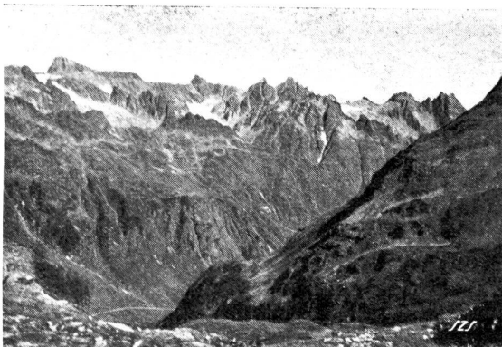
Passhöhe 2280 m. ü. M. Blick gegen Klein-Spannort, Seewenstock und Meiental (Gufenalp).

Die volkswirtschaftlichen und verkehrspolitischen Gründe für den Bau einer Sustenstrasse liegen darin, daß das große Fremdenverkehrsgebiet im Oberland eine Autostrasse nach Osten als direkte Zufahrt zum Gotthard und zum Klausenpaß längst schon nötig gehabt hat. Die Sustenstrasse würde einen großen Teil des Westostverkehrs vom Genfersee, über den Pillon und die Saanenmöser anziehen und durch das Oberland leiten. Ein wichtiger Anreiz dazu läge in dem Umstand, daß die künftige Sustenstrasse viel früher schneefrei ist als die Grimsel und Furka. Denn ihr Trasse führt fast ausschließlich sonnigen, den Lawinen wenig ausgelegten