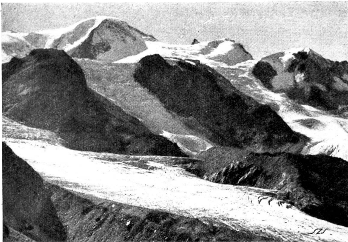
„Stuhlwang“. Blick gegen Südwesten auf den Steingletscher.

Vordergrund gestellt werden. Bei einem italienischen Angriff auf die bedrohte Südostgrenze wäre nämlich die Grimsel-Furka-Oberalproute vom Giacomopaß her so schwer bedroht, daß sie als Aufmarschlinie für die westschweizerischen Hilfstruppen nur sehr bedingt in Frage käme. Die 20 Kilometer nördlicher gelegene Sustenstrasse hingegen würde diesem Zwecke ausgezeichnet dienen. Nicht nur würde sie um etliche Stunden schneller zum Gotthard führen, sondern sie wäre auch der ideale Zufahrtsweg zum Panixerpaß via Klausenstrasse. Diese letztere müßte natürlich den militärischen Bedürfnissen noch besser angepaßt werden. Daß eine in diesem Sinne ausgebaut Westostverbindung die strategische Lage der Schweiz an ihrer Ostmark wesentlich verbessern würde, liegt auf der Hand.