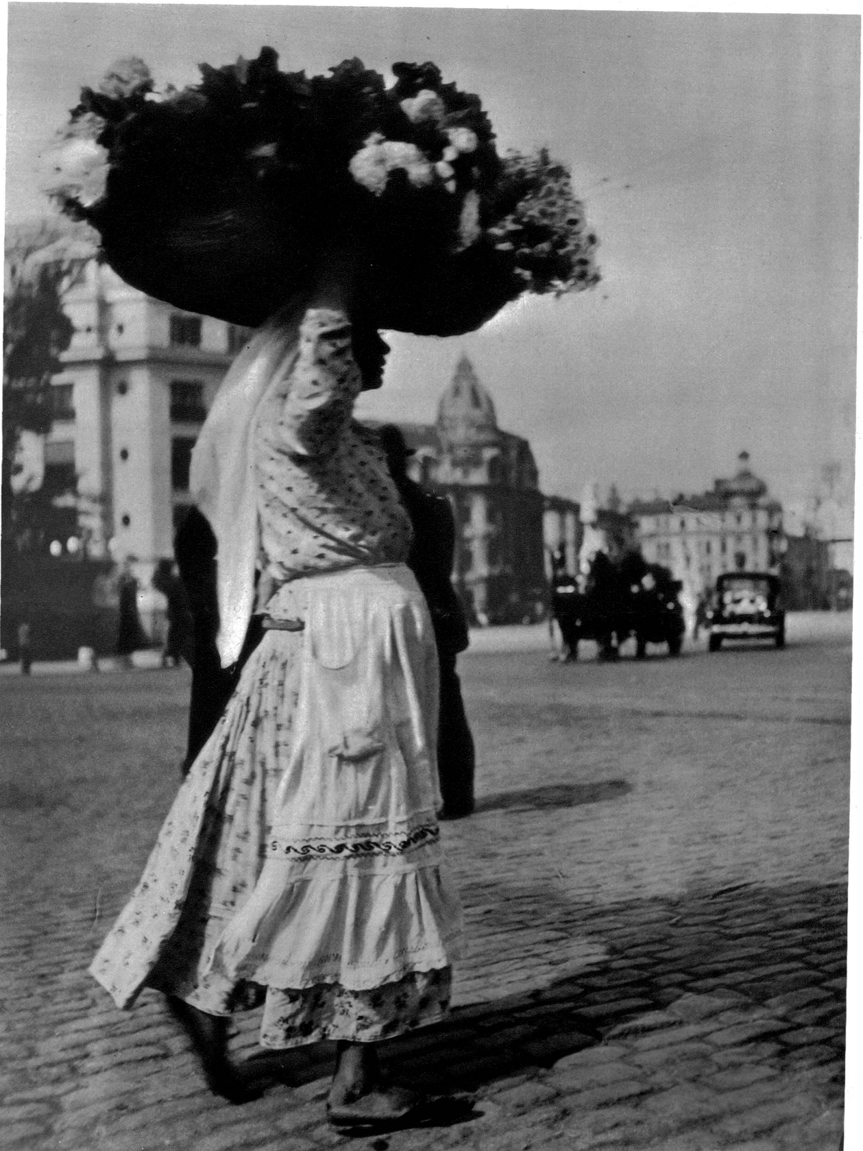
Gegen 200 Blumenverkäuferinnen finden ihren Verdienst durch Blumenverkauf in den Strassen von Bukarest, welche auch die Stadt der Rosen genannt wird.