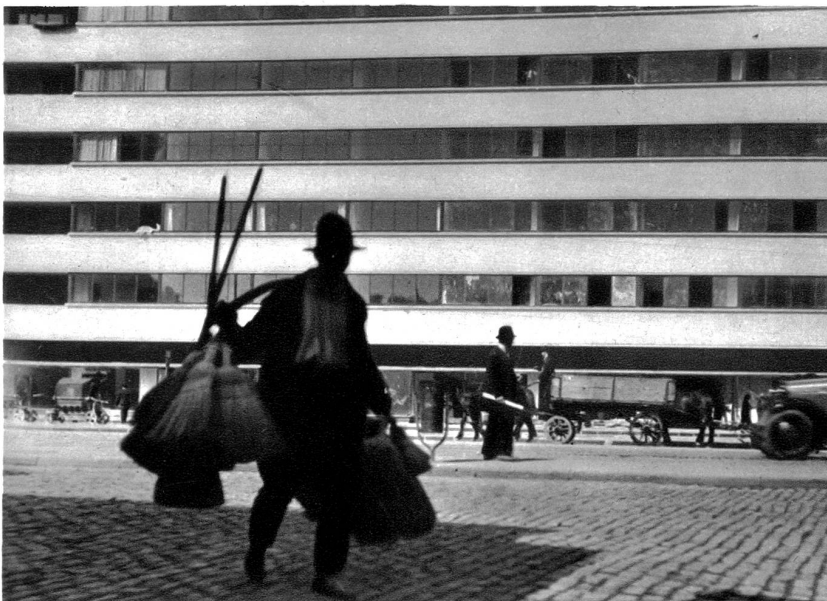
Der Besenhändler im neuen Viertel. Ob er seine Ware nicht bald mit Staubsaugern auswechseln wird?