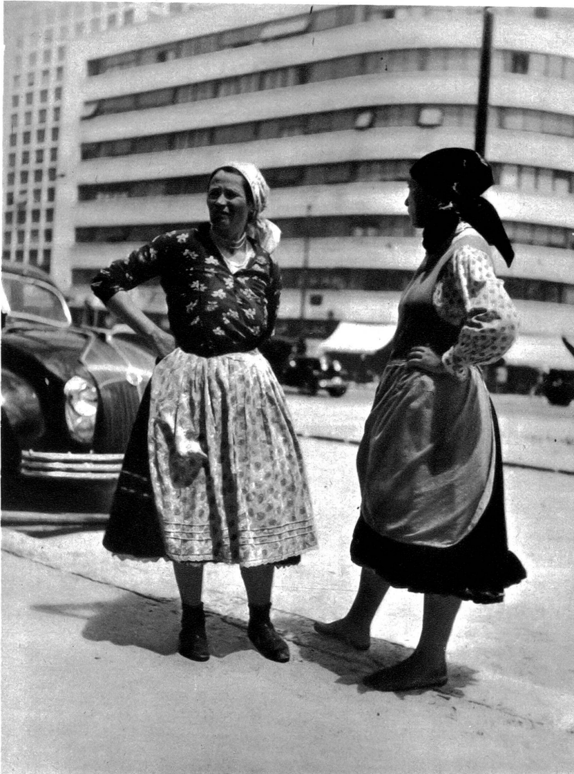
Rumänische Bauernfrauen, deren Männer in Neubauten beschäftigt sind, warten auf den Arbeitsschluss auf den Bauten.