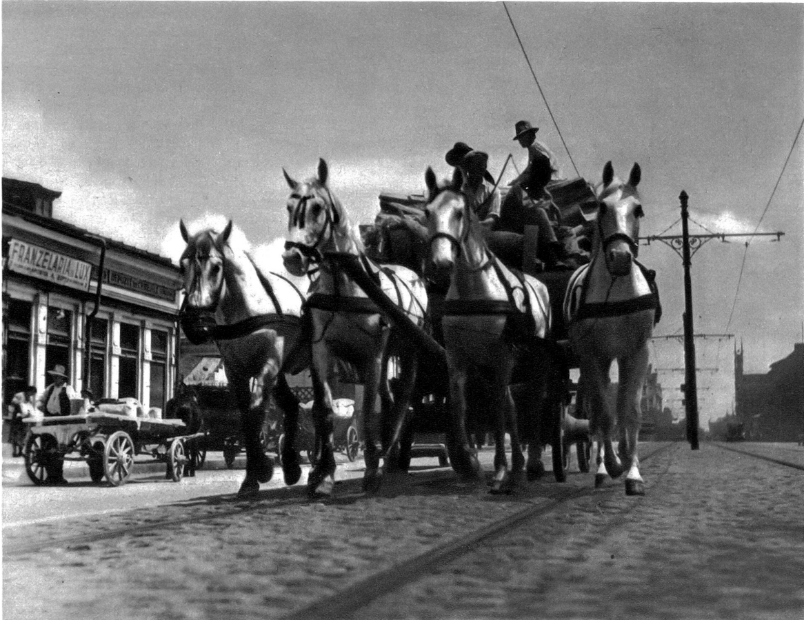
In hellem Trab kommen solche Vierspänner daher