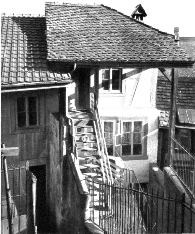
Treppe zum Zimmer der Zähringerfräulein