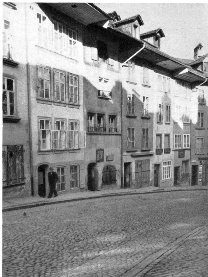
Häuser am Stalden, Sonnseite. Das Haus mit den kleinen Fenstern und dem halbrunden Schaufenster war das älteste Salzhaus