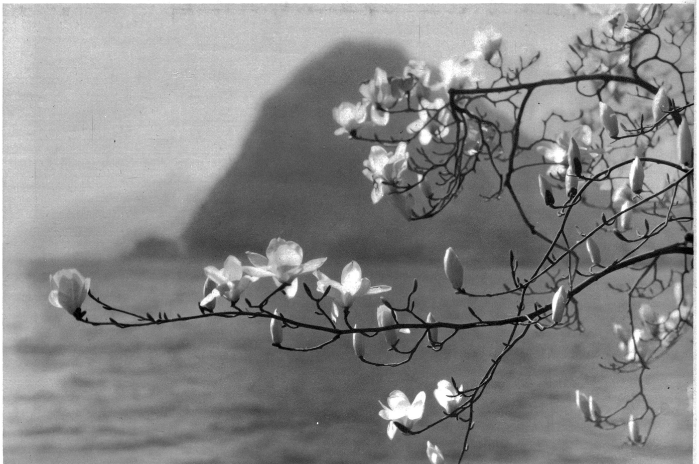
Magnolienpracht in Lugano