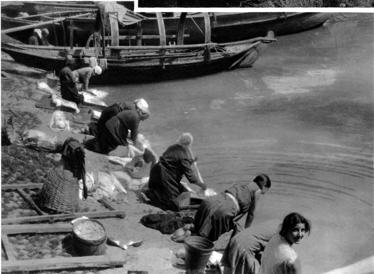
Wäscherinnen an den Ufern des Luganersees