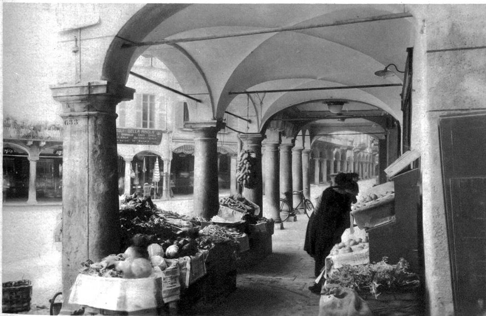
Lugano. Via Nassa

Lefer, sage ich, Mensch — überspringe einen Zug, zwei Züge, zwei Tage, zwei Wochen oder mehr in Lugano. Laß es auch regnen dabei. Geh hinauf zum San Salvatore, zum Monte Brè, hilf mit, die Heiligen zu feiern, sei es den Heiligen Josef in Sorengo ob dem idyllischen Muzzanersee, oder San Bernardo oder Gottardo bei irgend einem der vielen Kapellchen