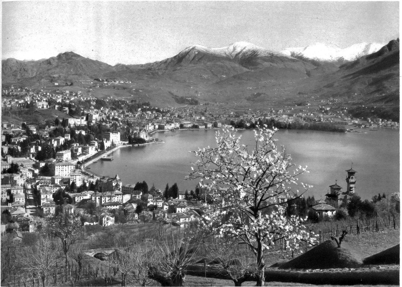
General-Ansicht von Lugano