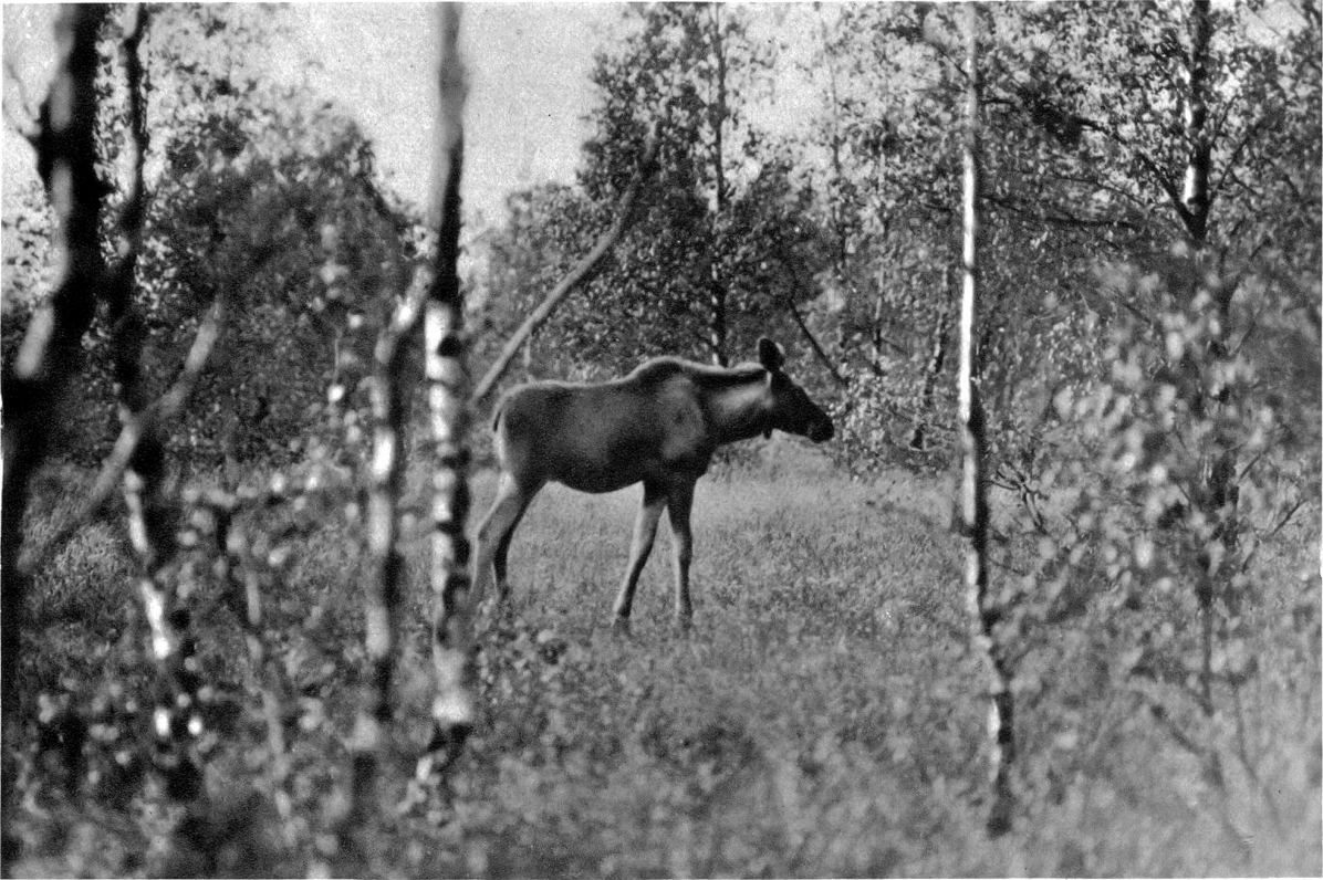
Elch im Revier