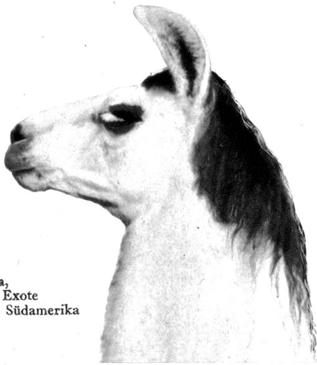
Lama, ein Exote aus Südamerika