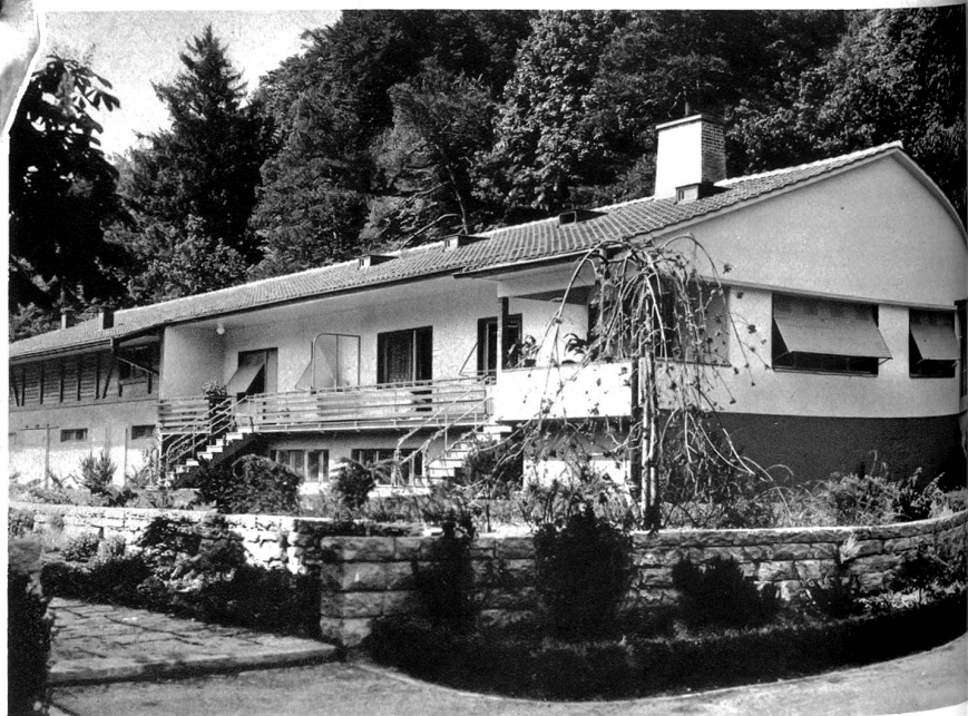
Verwaltungsgebäude des Tierparks

betrieben, ergänzt, erweitert werden. Daraus erwachsen dem Vereine neue Aufgaben, die an Wichtigkeit den bisherigen nicht nachstehen. Dies war die einhellige Ueberzeugung der in den letzten Tagen abgehaltenen zahlreich besuchten Mitgliederversammlung, welche einstimmig die Statuten dem neuen Ziele, F ö r d e r u n g des Tierparkes, anpaßte. Der Dählhölzli-Tierpark ist nicht ein reiner Naturpark. Die prächtigen gärtnerischen Anlagen lassen dies augenfällig erkennen. Der Natur- und Tierpark hat sich daher die Bezeichnung „Tierparkverein Bern“ gegeben. Als solcher wird er seine ganze Kraft einsetzen, um die Gemeinde ideell und materiell in der Förderung des Tierparkes