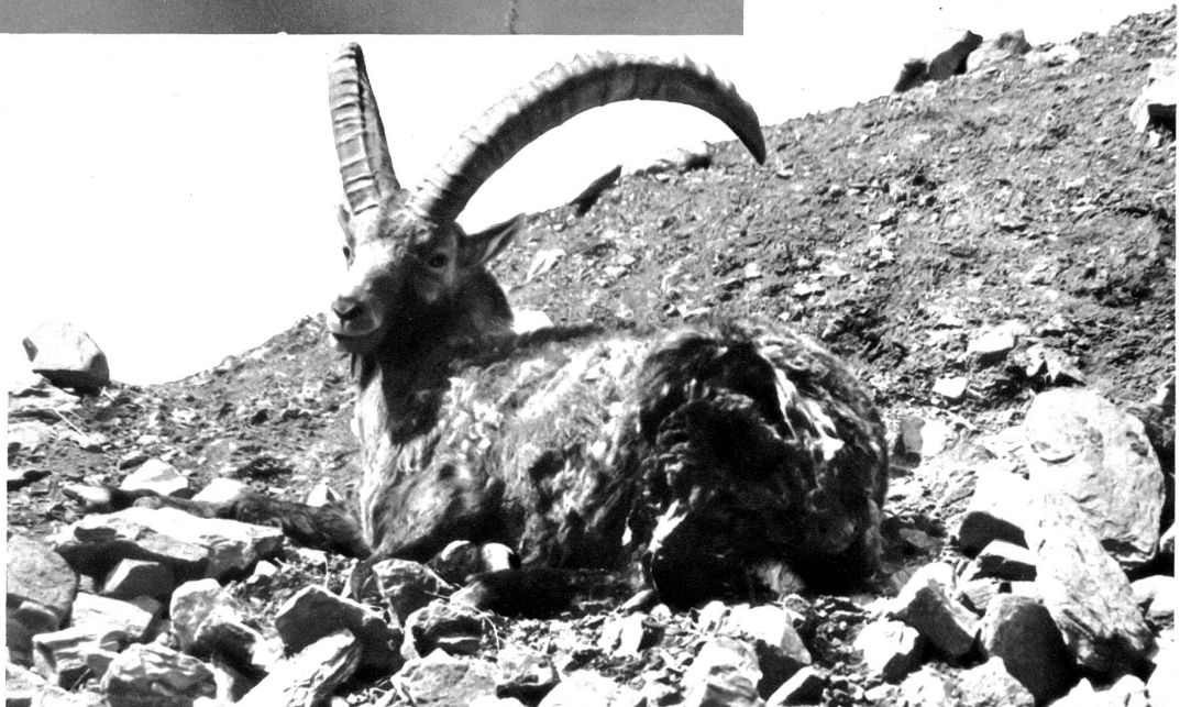
Aus der Steinbockkolonie