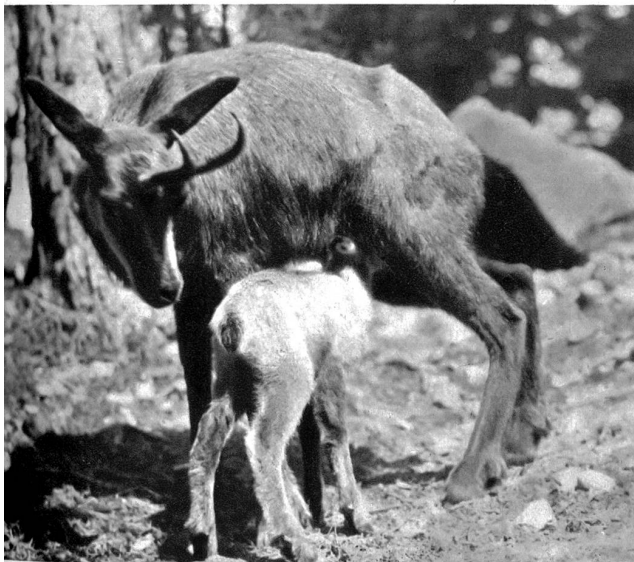
Gemse mit Jungen

zu unterstützen. Gelegenheit dazu wird sich bald genug bieten; man denke nur an die innere Einrichtung und planmäßige Erweiterung der Gems- und Steinbockgehege.