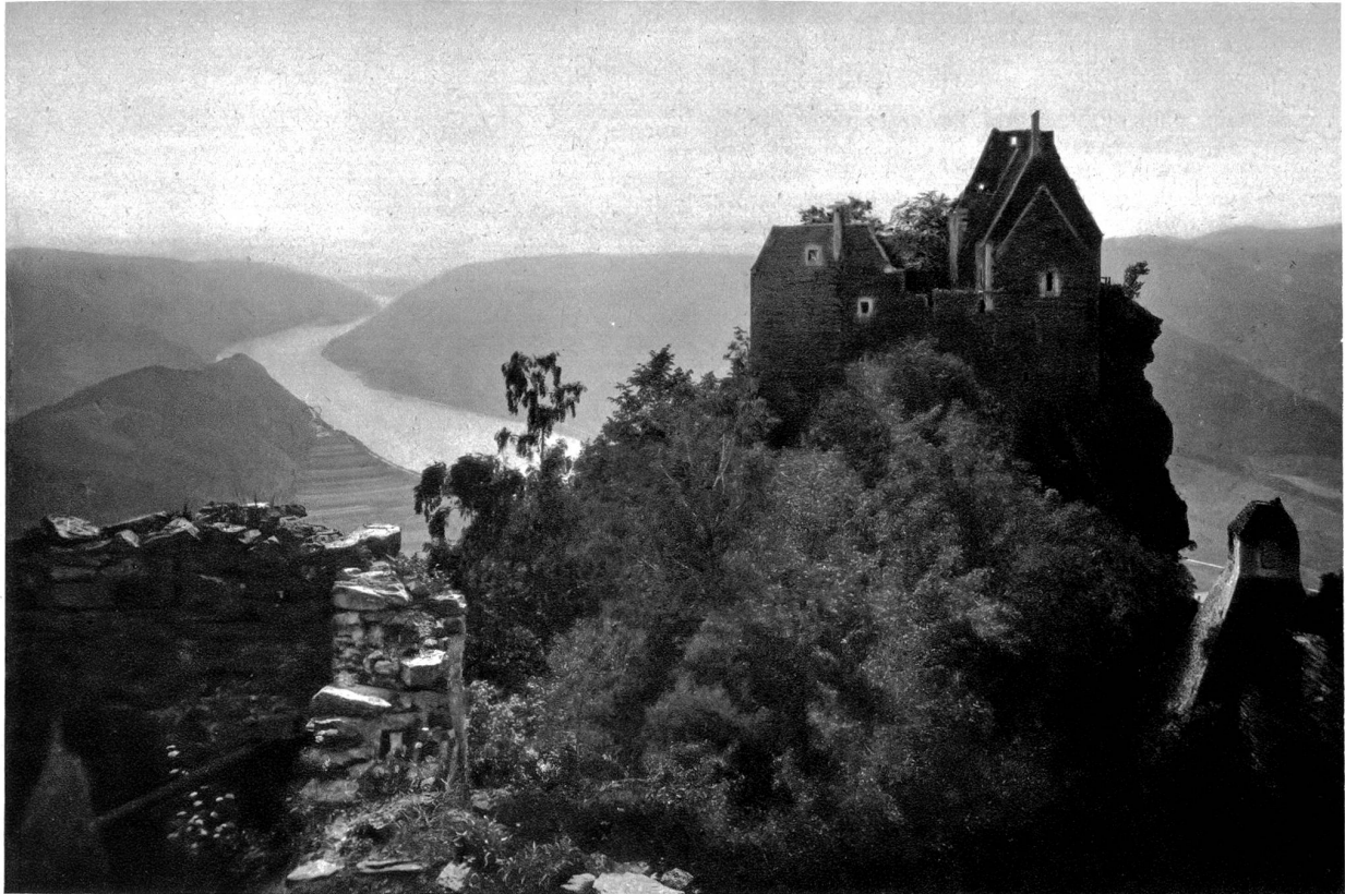
Ruine Aggstein mit seinem sagenhaften Rosengärtlein