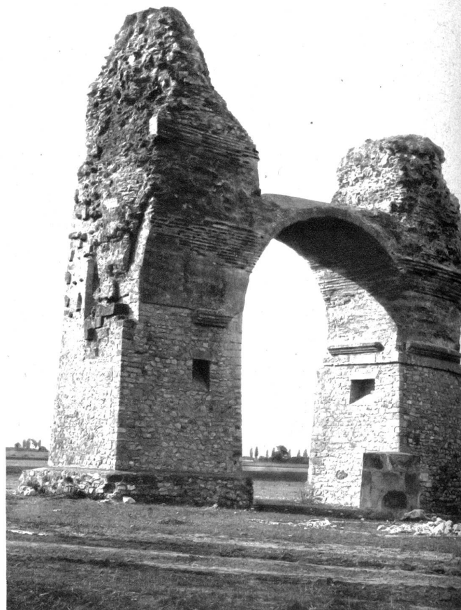
Das Heidentor bei Petronell, ein weithin sichtbares Ueberbleibsel aus der Römerzeit

Ein Donaudampfer gleitet durch sieben Länder; durch Deutschland, Oesterreich, Tschechoslowakei, Ungarn, Jugoslawien,