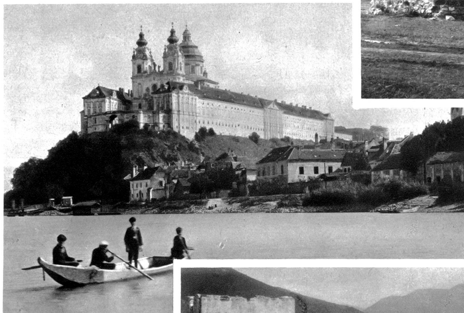
Das berühmte Babenbergerstift Melk

Spitz a. d. Donau. Im Vordergrund die Ruine Hinterhaus, einstige Trutzburg des Ritter von Kuenring. Ihr Bau, ganz aus Bruchsteinen naher Gneis- und Syenitlager aufgeführt, bezeugt noch heute die kühne Bauart ritterlicher Zeit. Ueber den wohl erhaltenen zackigen Ringmauern mit starken Rundtürmen an den Ecken erhebt sich ungebroschen ein mächtiger quadratischer Bergfried, der entzückenden Ausblick gewährt