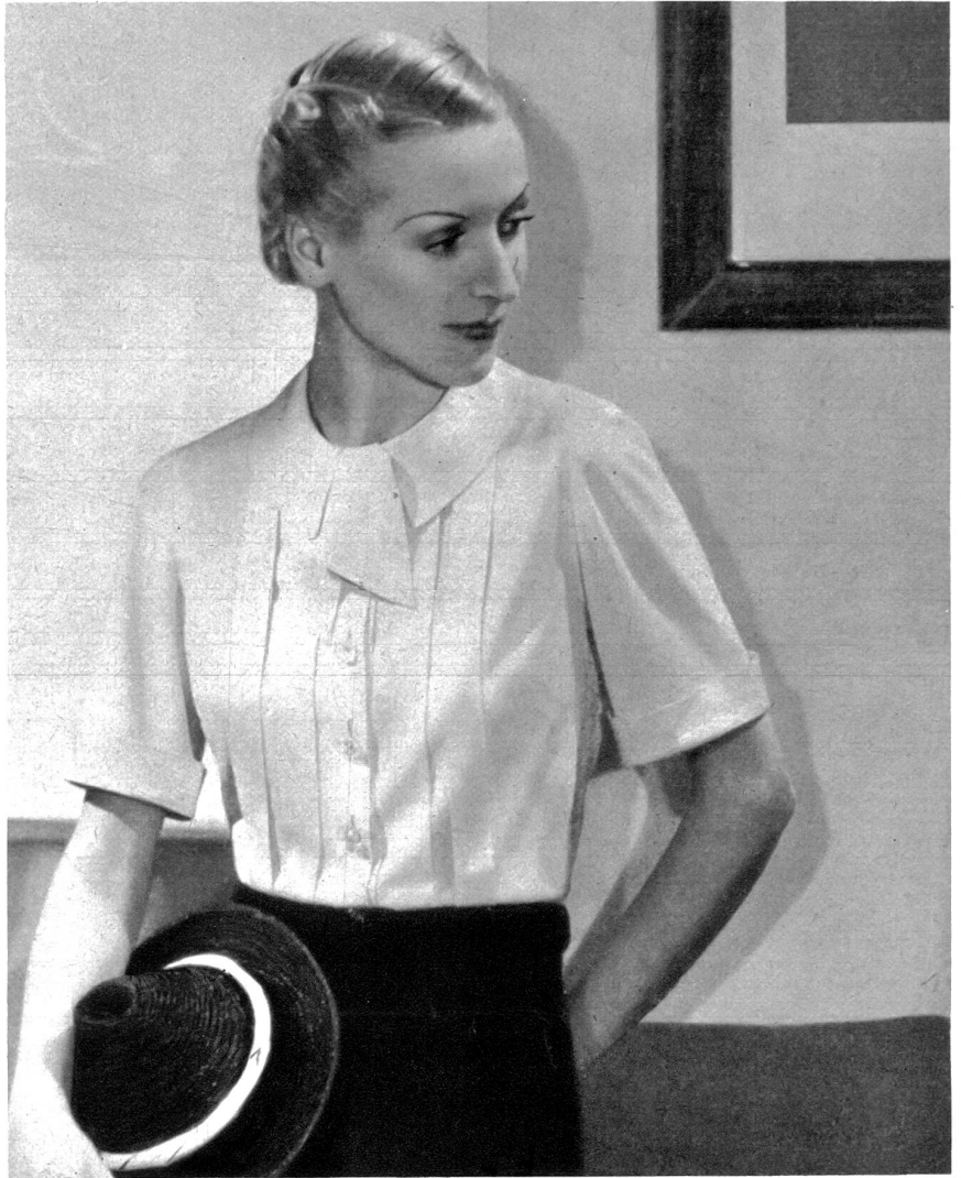
Nr. 1 Kleidsame Bluse aus weisser Waschseide; Stoffbedarf bei 0.80 cm Breite 2.20 m, bei 1 m Breite 1.70 m Zuschneiden und Heften Fr. 2.80

Die Rücksendung erfolgt prompt unter Nachnahme für das Zuschneiden.