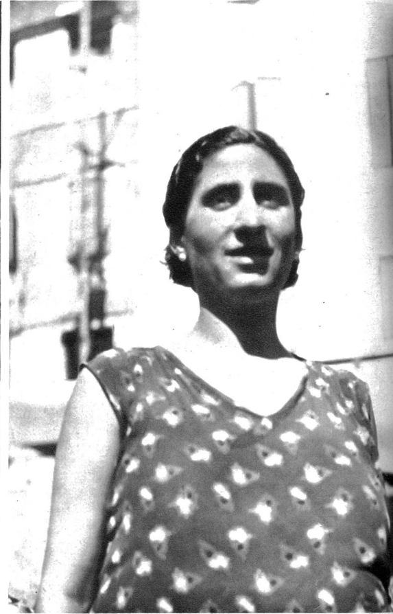
Schöne grosse Menschen mit südländischem Blut bevölkern den Vieux Port