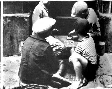
Mit Karten spielen bereits diese Fischerbuben um Kupferpfennig