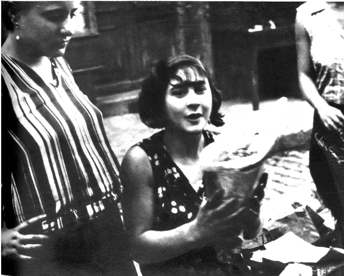
Sie sitzt in der Rue Caisserie mitten unter vielen Marktfrauen und verkauft spanische Nüsschen.