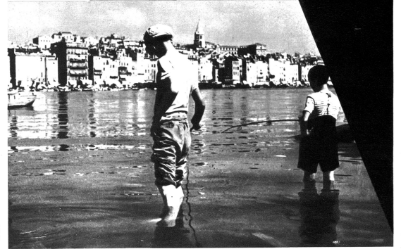
Marsellaner Buben sorgen für Masters Pfanne