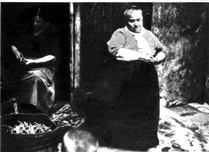
Die Holz- und Kohlhändlerin. Sie schreit nicht wie die vielen Marktfräuen. Sie sitzt gemütlich vor ihrem kleinen Geschäft und döst