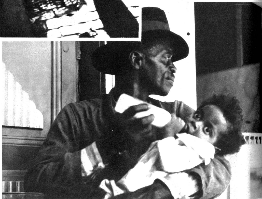
Der brave Negervater gibt seinem kleinen Mohrechöpfli das Fläschchen