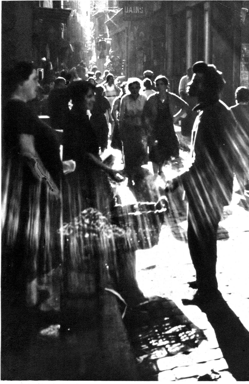
Belebte Strasse im alten Hafenviertel in der Mittagssonne