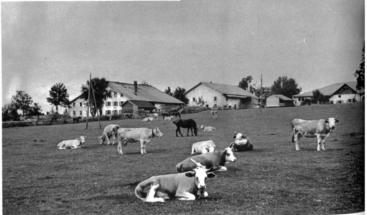
Bei Cerlatez in den Freibergen