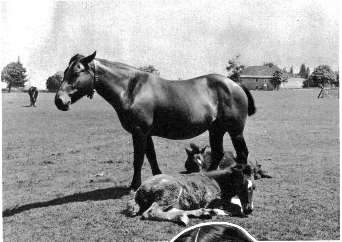
In den Freibergen. Saignelégier

wogende Aehrenfelder fehlen fast ganz. In den Jurawäldern wohnt andächtige Stille. In ihrem Duster lebt das Märchen und das Geheimnis. Die Tannennadeln und die Moose weben weiche Teppiche zwischen die Stämme, und die Farne wuchern wirr umher, und manche seltsame Blume gedeiht in ihrer Einsamkeit. Die blauen und gelben Helme des Eisenhuts findet man da und die schöne Türkenbundlilie, der schöne Frauenschuh, diese beinahe ausgestorbene Orchidee.