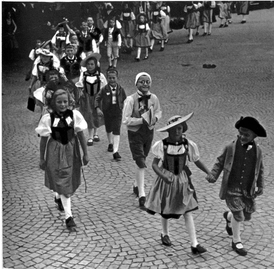
Besonders reizvolle Kindergruppe aus dem Festzug des Bernischen Kantonschützenfestes in Langnau