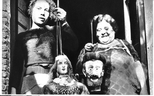
Lebende und tote Köpfe, „alles hängt an Fäden“, so ist das Leben . . . .