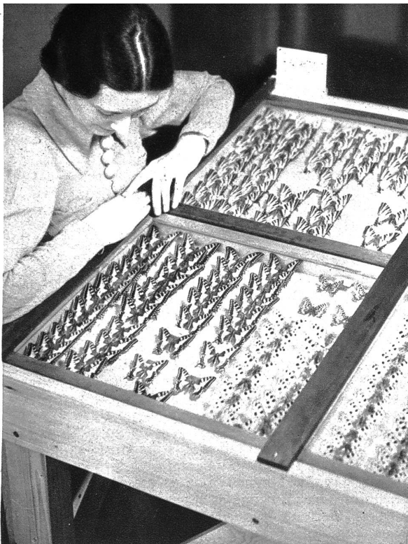
Die grösste Schmetterlingssammlung der Schweiz, zusammengestellt vom verstorbenen Obersten Vorbrod, ist vom Naturhistorischen Museum in Bern angekauft worden. Die Sammlung ist für Besichtigung zugänglich gemacht worden. Es ist die grösste und zugleich schönste Lepidopterenammlung, die in der Schweiz je angelegt wurde und umfasst zirka 21,880 Stück von 2118 Schmetterlingsarten.