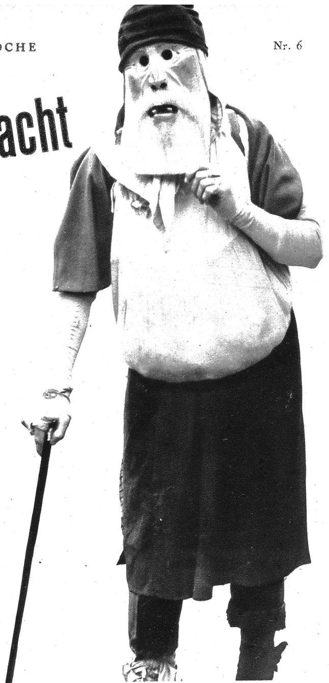
Der „Alte“ von Flums, eine der einfallsreichen Masken des Maskenschnitzers von Flums

Zwischen der Herrenfastnacht und dem Sonntag Lätare spielt sich in unserer Schweiz eine Fülle solcher Kultäußerungen und alten Gebräuche ab, aus der wir nur eine Blütenlese vorlegen wollen. Die Herrenfastnacht oder der Sonntag Estomihi, das Fasten der „Herren“ und der „Pfaffen“ im Mittelalter, und die gleich darauffolgende Bauernfastnacht, der Fastnachtmontag, leiten die Fastnachtsgebräuche allgemein in der Schweiz ein. Am Fastnachtmontag laufen die „Buzi“ und „Hudelweiber“ von Flums, deren Grundsatz ist, möglichst häßlich zu sein, der „Alte“ von Wallenstadt, eine historische Maske, mit