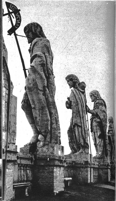
Heiligenstatuen auf dem Dache des Petersdomes.