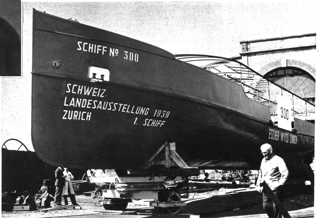
Das 1. Landesausstellungsschiff, das während der Ausstellung den Personenverkehr über den Zürichsee bewältigen wird, hat die Werft verlassen und wird am Montag durch die Stadt Zürich zum See gezogen. Es ist das 300. Schiff, das in den Escher-Wyss-Werkstätten erbaut wurde. Die Firma blickt gleichzeitig auf 100 Jahre Schiffbau zurück.