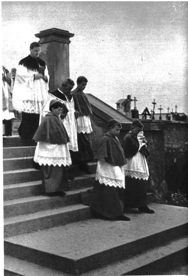
Flurprozession auf der Kirchentreppe in Goms

Das Maihereinläuten im St. Galler Rheintal, ein alter, schöner Brauch, ist fast ausgestorben, seit die elektrischen Geläute in die Kirchtürme eingezogen, und die Burschenschaft