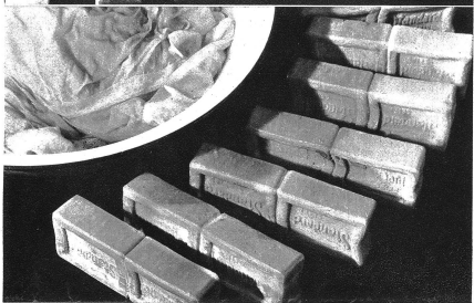
Etwa 17 Stück Waschseife