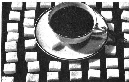
Etwa 125 Gramm reinsten Zuckers