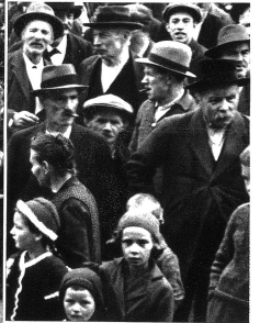
Zuschauer beim Glockenaufzug