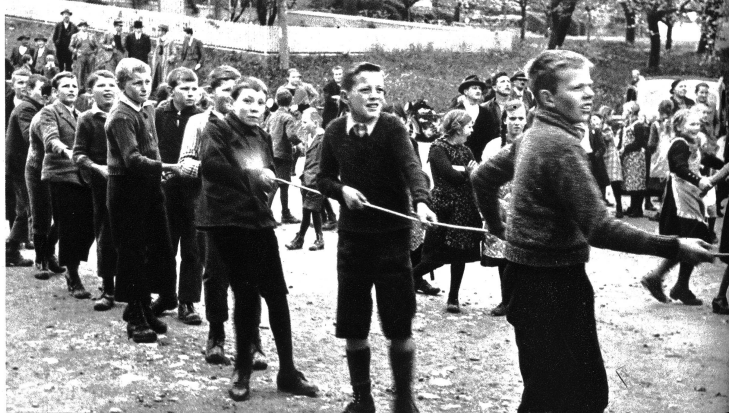
Die Burschen des Dorfes warten auf das Kommando zum Ziehen des Seiles

fein Können und seine vorzügliche Schulung bewies. Es darf vielleicht noch erwähnt werden, daß Wappenschilder, Inschriften und sonstige Verzierungen auf den zwei gestifteten Glocken nach Entwürfen von Walter Burdhardt, Graphiker in Suttwil, ausgeführt wurden. In feinsinniger Weise verstand er es, in symbolischer Zeichnung des tragischen Schicksals der beiden so jung Tollendeten zu gedenken.