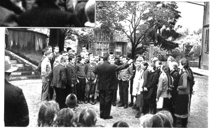
Die Oberschule singt zur Feier des Tages...