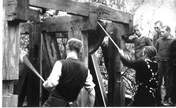
Das Ausläuten der alten Glocken

fein Können und seine vorzügliche Schulung bewies. Es darf vielleicht noch erwähnt werden, daß Wappenschilder, Inschriften und sonstige Verzierungen auf den zwei gestifteten Glocken nach Entwürfen von Walter Burdhardt, Graphiker in Suttwil, ausgeführt wurden. In feinsinniger Weise verstand er es, in symbolischer Zeichnung des tragischen Schicksals der beiden so jung Tollendeten zu gedenken.