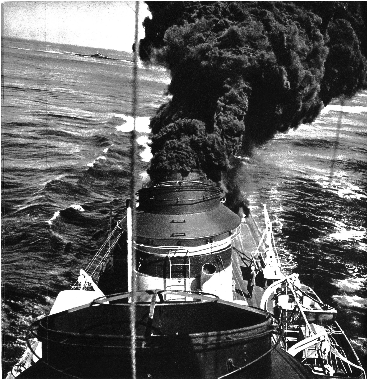
Mit Volldampf voraus

Einem unserer Mitarbeiter wurde die Erlaubnis gegeben, während der französischen Hochseemanöver auf dem Flaggschiff zu photographieren. Was er nach Hause brachte, geben wir hiermit unsern Lesern wieder, ihnen damit eine neue Welt erschließend. Leider eine Welt von Vernichtung und Tod. Was könnten mit den Milliarden, die von allen Staaten in die Hochseeflotten investiert werden, für Kulturwerte geschaffen werden! Erleben wir wohl noch einmal die Zeiten, wo die Völker zueinander wieder Glauben und Vertrauen fassen? Oder besteht der „Weltfriede“ in den ungeheuren Aufrüstungen?