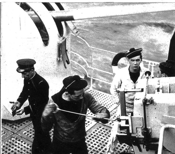
Links: Eine Salve dröhnt über den See . . .