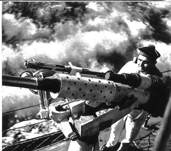
Am Fliegerabwehrgeschütz wartet dem Matrosen eine schwere Aufgabe

Einem unserer Mitarbeiter wurde die Erlaubnis gegeben, während der französischen Hochseemanöver auf dem Flaggschiff zu photographieren. Was er nach Hause brachte, geben wir hiermit unsern Lesern wieder, ihnen damit eine neue Welt erschließend. Leider eine Welt von Vernichtung und Tod. Was könnten mit den Milliarden, die von allen Staaten in die Hochseeflotten investiert werden, für Kulturwerte geschaffen werden! Erleben wir wohl noch einmal die Zeiten, wo die Völker zueinander wieder Glauben und Vertrauen fassen? Oder besteht der „Weltfriede“ in den ungeheuren Aufrüstungen?