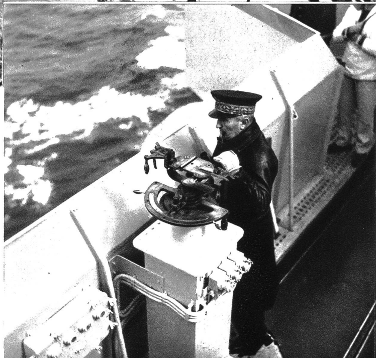
Auf der Kommando-Brücke des Flaggschiffes