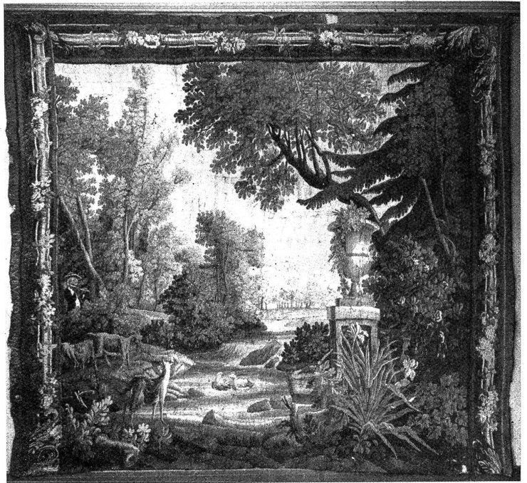
Wandbehang, aus dem XVIII. Jahrhundert.

Wie viel Verdruf und Aerger setzt es ab, wenn man erst nach Beendigung der Arbeit, die man irgendwo gekauft hat, zum Fachmann geht, um solche montieren zu lassen. Da paßt dann plötzlich die Größe nicht, entweder ist das Muster zu groß und es fällt ringsherum viel der so großen Arbeit ab, und das Muster ist nicht richtig angeordnet, oder die Arbeit ist zu klein und es muß noch angefügt werden, dann ist aber plötzlich die gleiche Wolle nicht mehr erhältlich. Ach, wie viele Klagen muß in dieser Beziehung der Tapezierer entgegen nehmen, nur weil sein Kunde diesen elementaren Grundsatz nicht befolgt und ihn als Fachmann nicht vor Anschaffung der Arbeit zu Rate gezogen hat. Also erft sich vom gelernten Tapezierer richtig beraten lassen.