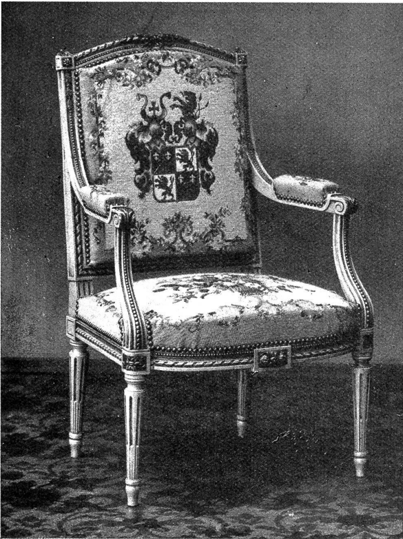
Louis XVI.-Fauteuil. Sitz Blumenmotiv, Rücken aufgesticktes Wappen. Grund demi-point. Ornamente in point de gobelin und Wappen in petit point.

zum großen Wandbehang in Gobelinstick, petit point, oder Blattstick.