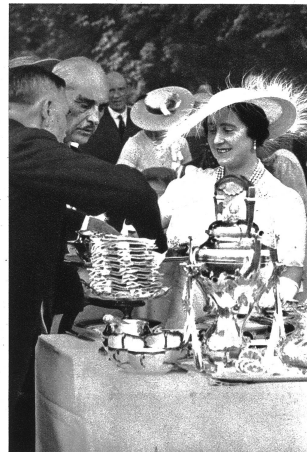
Auf der Gardenparty in Bagatelle. Am Nachmittag des zweiten Tages des Staatsbesuchs fand in Bagatelle eine „Gardenparty“ statt