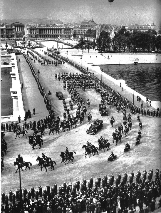
Die königlichen Wagen auf der Fahrt nach dem Quai d'Orsay. Oben das Verkehrsregelungsluftschiff, das von Polizisten besetzt, auf radiotelegraphischem Wege den Verkehr während den Ausfahrten des Herrscherpaares regelt.