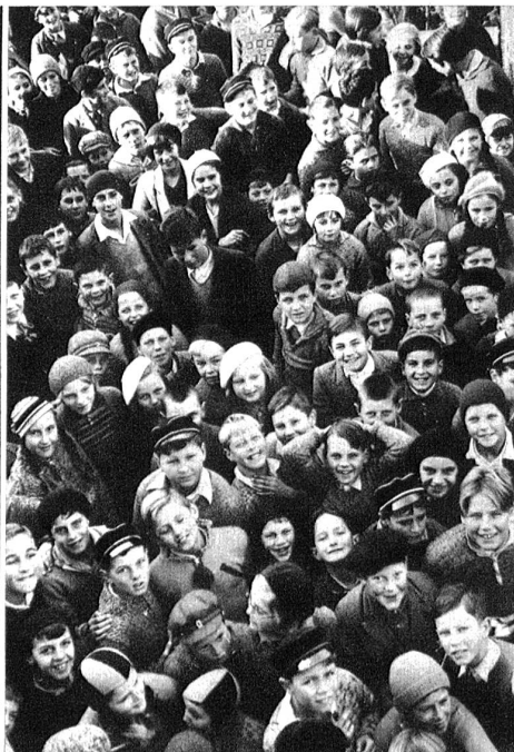
Voll sportlicher Begeisterung folgen schon „jüngsten der Jungen“ den Ka We De-Veranstaltungen.