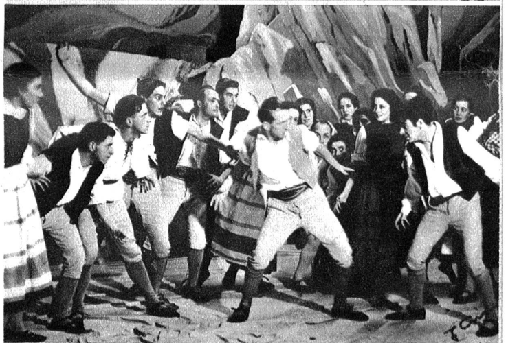
Aus der Tanzpantomime „Das Dorf unter dem Gletscher“ von Heinrich Sutermeister und Albert Rösler.