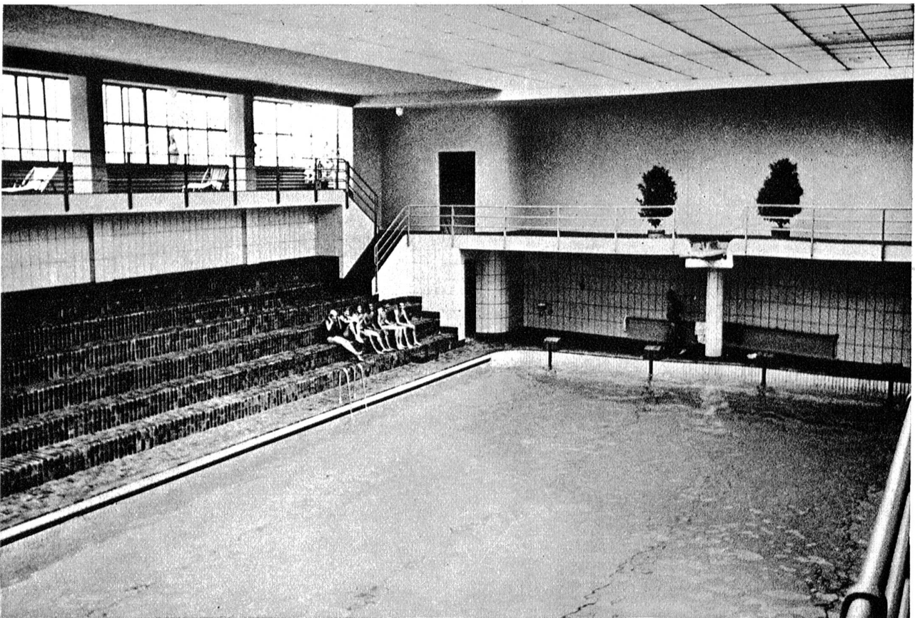
Die gegenüberliegende westliche Seite der Halle mit dem 3 Meter-Brett. Links unten auf der geheizten Stufenrampe einige Mitglieder des Schwimmclubs Bern, für die das neue Bad eine willkommene Trainings- und Wettkampfmöglichkeit bietet.