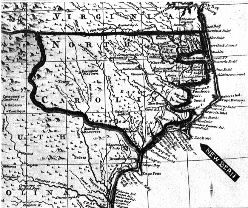
Karte von Nord Carolina aus der Mitte des 18. Jahrh. New Bern ist bereits eingezeichnet, das Hinterland trägt noch durchwegs die indischen Ortsbezeichnungen. Eine Strasse führt bereits vom Albemarle Sound und Bath, der ältesten Stadt in Nord Carolina, die jedoch heute bis auf wenige Häuser verschwunden ist, nach New Bern und von da aus nach Brunswick Town und südwärts der Küste entlang nach Charlestown, der Hauptstadt von Süd Carolina.