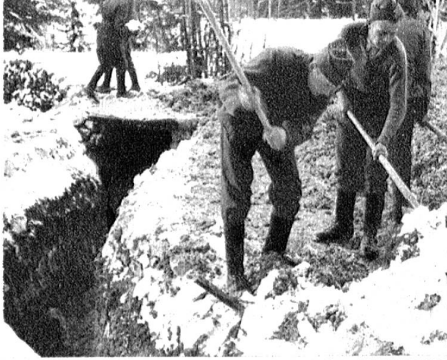
Solche Laufgraben verbinden zu hunderten die Unterstände.