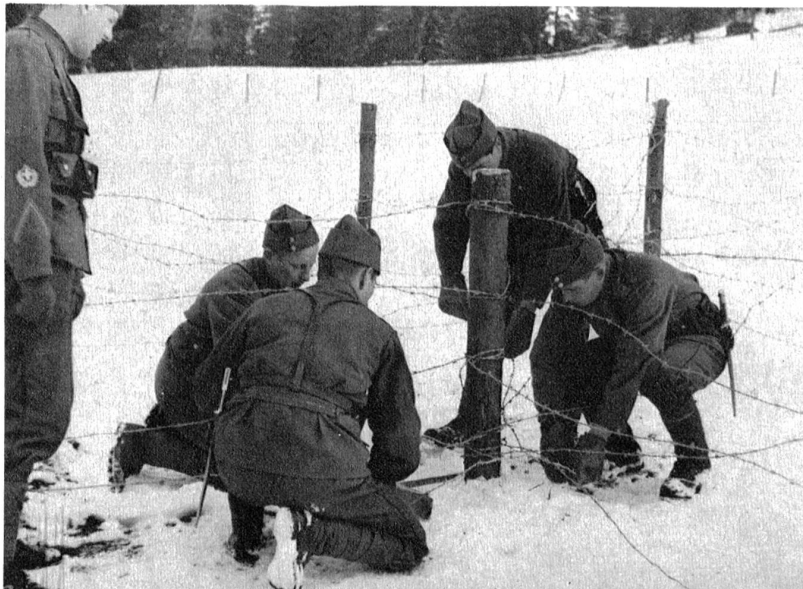
Drahtverhau. Trotz Kälte, Sturm und Schneegestöber dürfen die Arbeiten nicht unterbrochen werden.