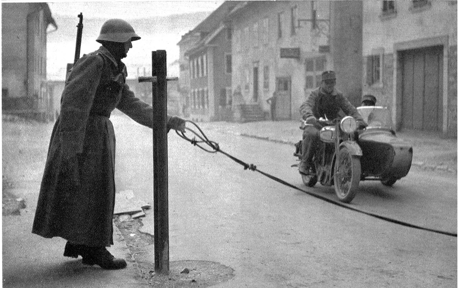
Kontrolle vor der Grenzsperr.