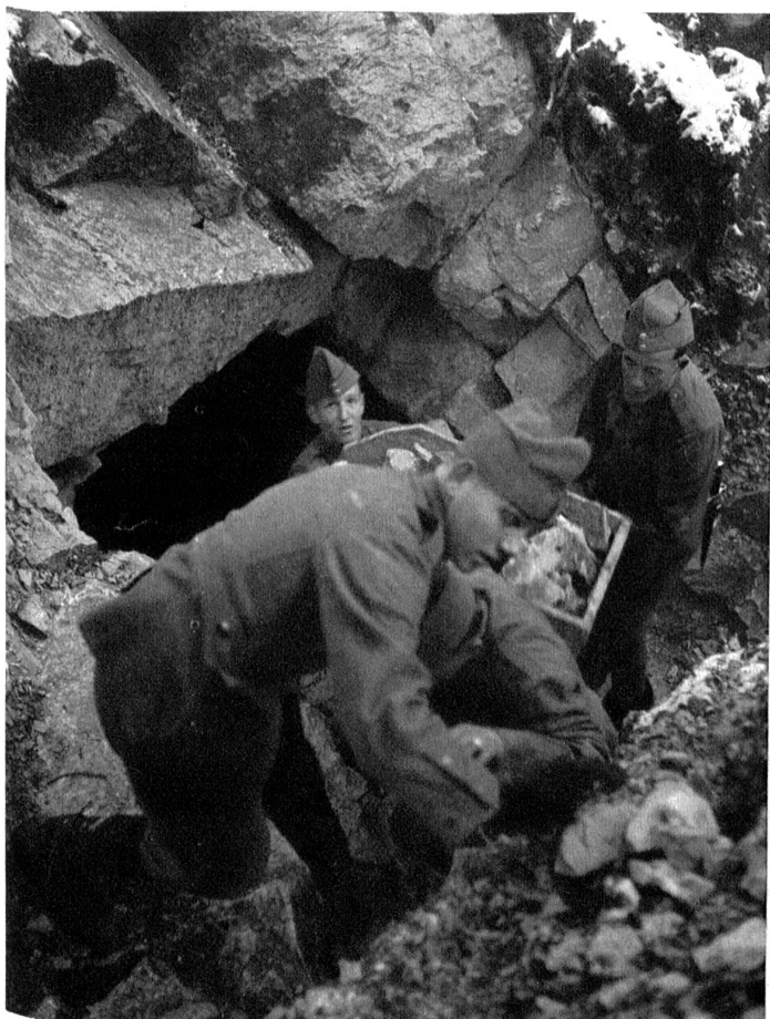
Der Fels bietet den besten Schutz gegen Flieger und Artilleriebeschuss. Mit Bohrhammer und Kompressoren werden zahlreiche Felshöhlen ausgehoben.