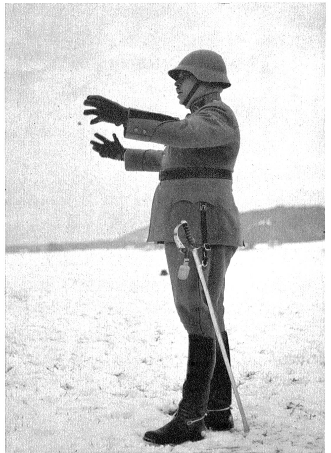
„So grvft dr Bär a und so han i's mit mym Regimänt welle ha“, erklärt hier der Oberst.

Der Oberst muß sein Regiment, das er in schwerster Stunde an die Front geführt und mit dem er während Monaten des aktiven Dienstes Freud und Leid geteilt hat, verlassen, um als Instruktionsoffizier andern Pflichten nachzukommen. Offiziere, Unteroffiziere und Soldaten bedauern den Weggang ihres äußerst loyalen und tüchtigen Kommandanten und geben bei der Abschiedsfeierlichkeit ihrer Hoffnung Ausdruck, ihn in absehbarer Zeit wieder zurückzuerhalten.