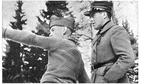
Inspektion eines eben gebauten Hindernisses durch den Kommandanten des Stützpunktes.