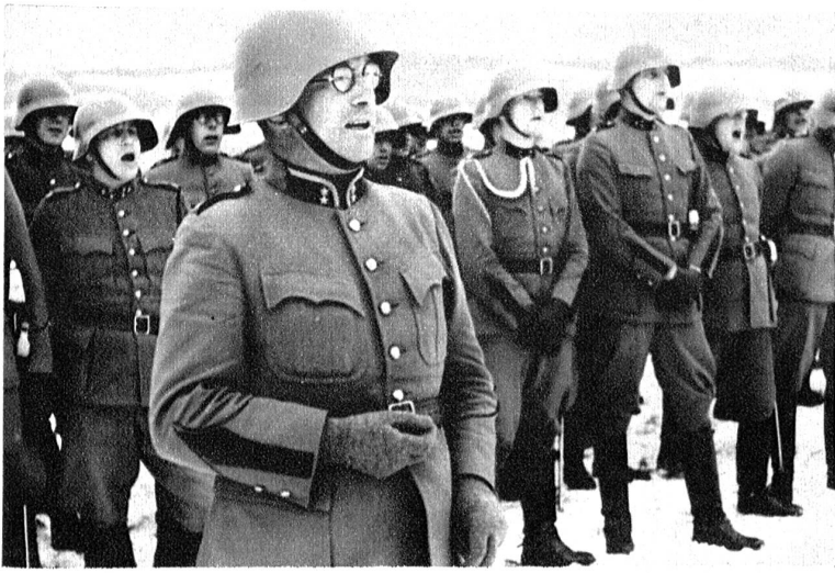
Die Offiziere singen ihrem Berner Kommandanten zum Abschied den „Bärner Bär“.