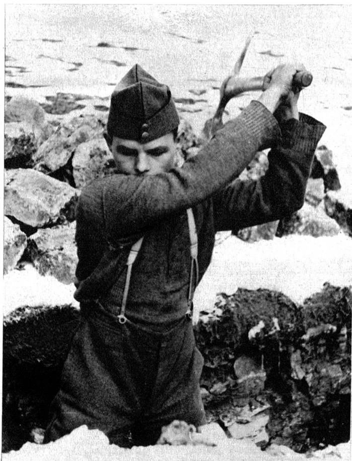
Manch Schreiber und Stubengeselle ist zum Schwerarbeiter geworden und hat heute Schwielenhände.