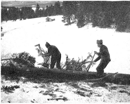
Auch die stolzen Juratannen müssen, der Not der Zeit gehorchend, fallen.