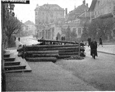
Tankbarrikade im Bau.