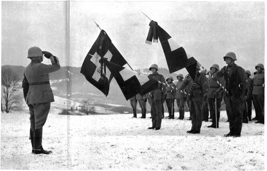
Der letzte Gruss den Fahnen!