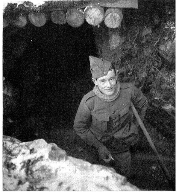
Trotz harter Arbeit sind unsere Soldaten guter Laune.