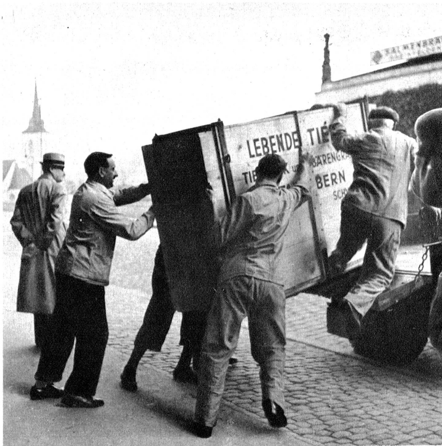
Wie sie nach Berlin reisten