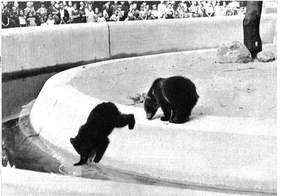
Der Wassergraben dient nicht nur der Absperrung, sondern auch der Erfrischung und dem Spiel.