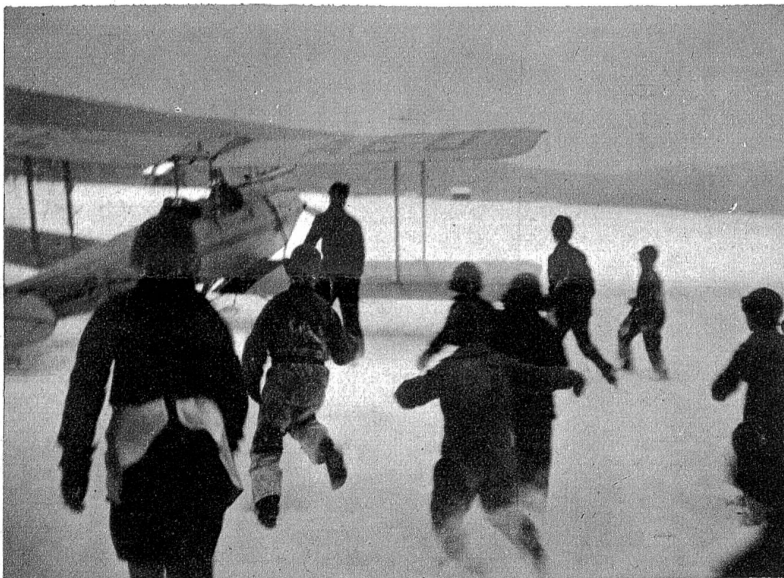
Von allen Seiten kommen Kinder aufs Eis gesprungen, wo soeben in einem kleinen Sportflugzeug der erwartete Arzt gelandet ist.