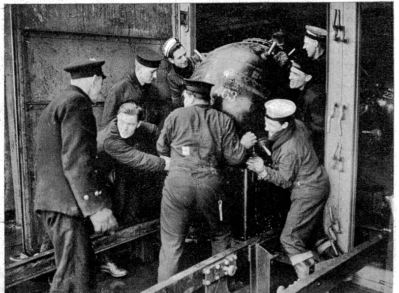
Die Mine ist zum Abwurf bereit. Sie explodiert, wenn ein Schiff einen der seitlich angebrachten Zapfen berührt und abstößt. Die verheerende Wirkung der grossen Sprengladung bewirkt, dass ein Schiff oft nach wenigen Minuten versinkt