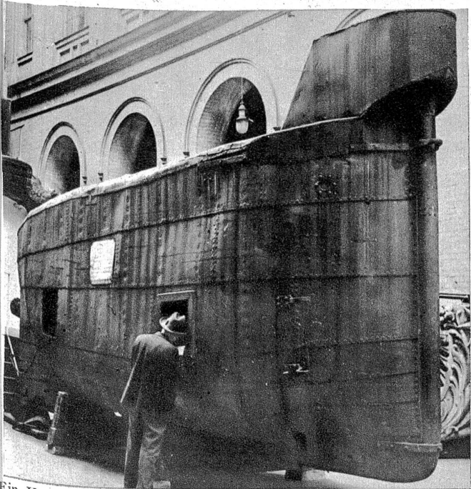
Ein Vorläufer der gefährlichsten heutigen Seekriegswaffe. Das erste wirklich gebrauchsfähige Unterseeboot, das im Jahre 1851 von Wilhelm Bauer gebaut wurde, ist gegenwärtig im Hof des Deutschen Marinemuseums in Berlin ausgestellt.