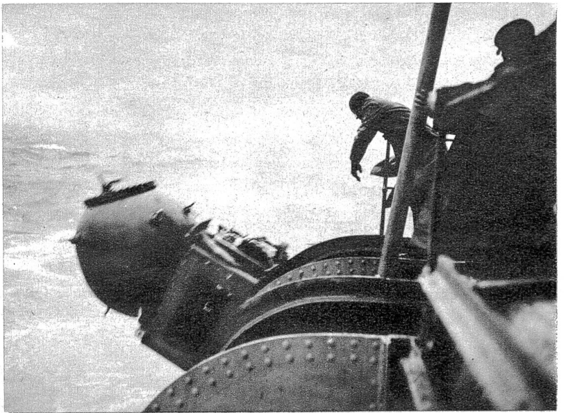
Eine Seemine wird vom englischen Minenleger „Pembroke“ ausgesetzt. Ein fast 1000 km langer und oft über 70 km breiter Minengürtel schützt die engl. Ostküste.