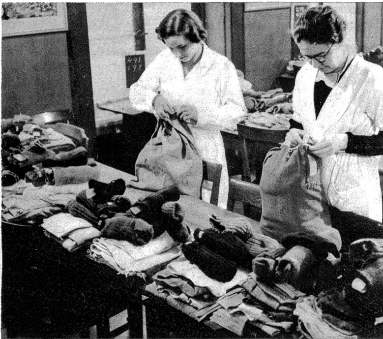
Die Sachen sind versandfertig zusammengestellt und werden nun wieder in die Wäschesäcklein verpackt. Nicht selten findet der Empfänger dazu noch eine Kleinigkeit zum Essen oder etwas zum Rauchen drin und selbstverständlich ein Briefchen mit vielen Grüßen von der Kriegswäscherei!