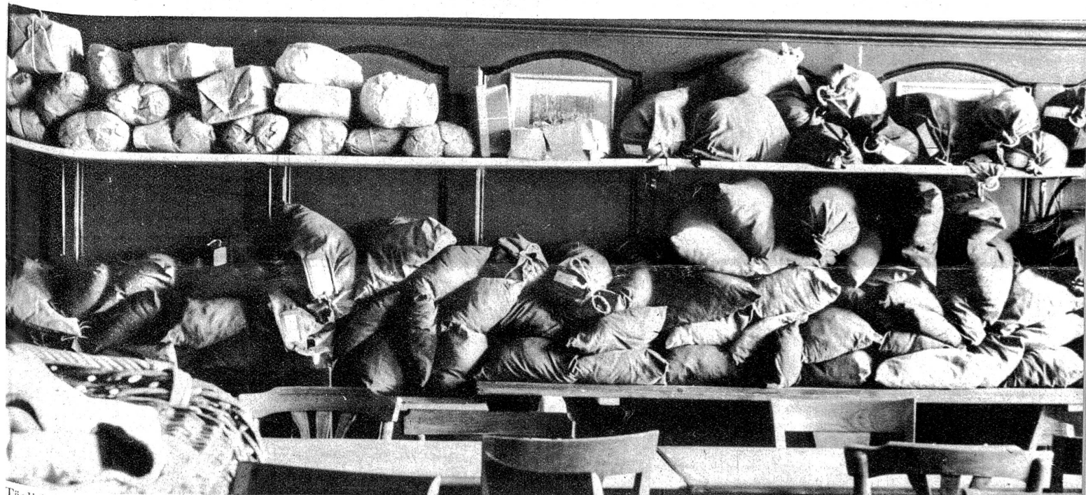
Täglich gehen Hunderte von Paketen und Säcklein ein. Sie müssen alle registriert und ihr Inhalt sortiert werden.