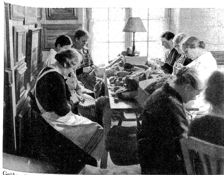
Geübte Hände lassen auch die grössten Löcher verschwinden. Hier wird eine neue Ferse angestrickt, dort muss ein Loch verwoben, da ein Stück eingesetzt oder ein Knopf angenäht werden.