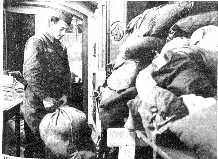
Wieviele Soldaten gibt es, die keine Angehörigen haben, — denen niemand zu Hause das Wäschesäcklein packt und die Socken flickt! Für sie hat die Kriegswäscherei sozusagen Mutterstelle übernommen, denn auch ihnen müssen ihre Sachen wieder hergerichtet werden. Die Feldpost besorgt den An- und Abtransport der Wäschesäcklein von allen Truppenteilen aus der ganzen Schweiz.