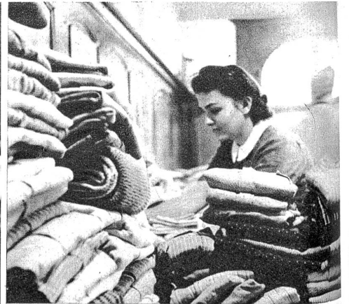
Die geflickten und geglätteten Wäschestücke sind abgabefertig und müssen nun nach ihren Besitzern sortiert werden.