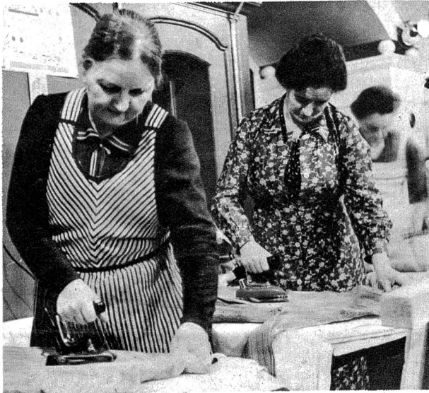
In der Glättere