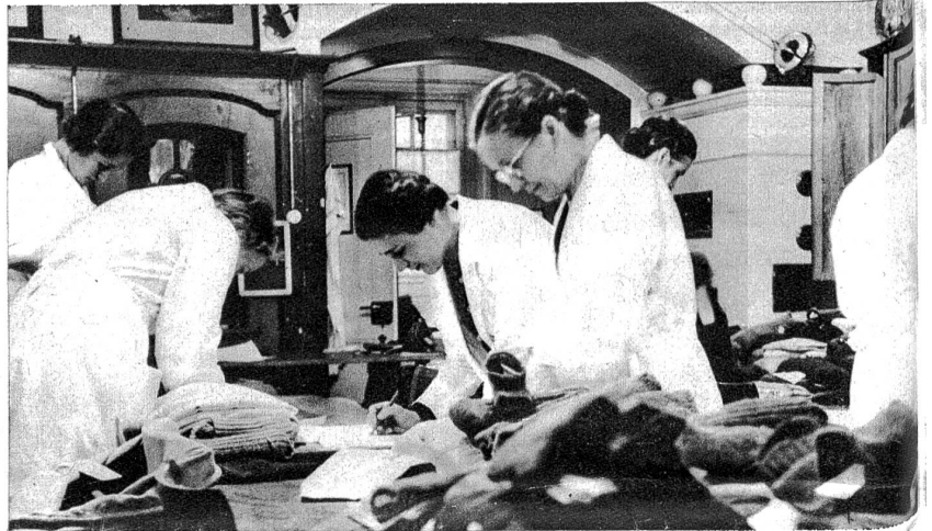
Jedes Wäschesäckchen wurde genau registriert und wird nun wieder anhand des aufgenommenen Etats zusammengestellt.