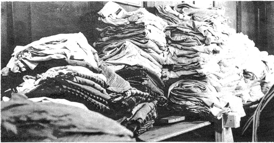
Berge von Hemden, die aufs Glätten warten.