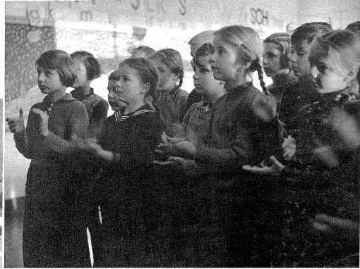
Auch hier kann man sich ruhig niederlassen, auch hier wird gesungen. Das Händeklatschen gilt aber nicht etwa der eigenen Leistung: das ist eine rhythmische Übung beim Gesang.