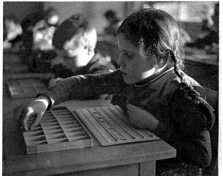
Ganz wie in einer Buchdruckerei, so sieht heute eine Leseübung am Setzkasten bei Erstklässlern aus.