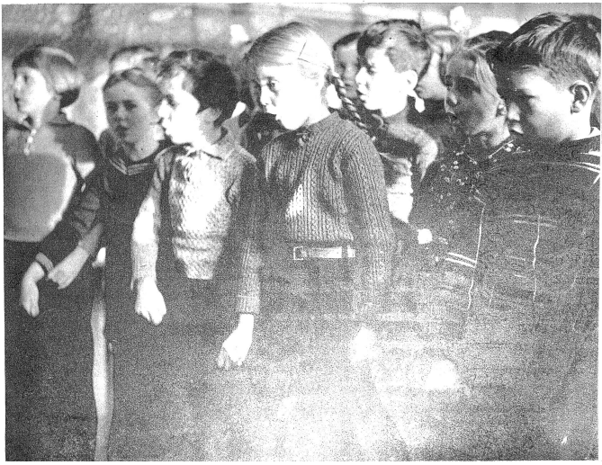
Tiefes gehts nimmer... Das tiefe „Do“! Der tiefste Ton, den man herausbringen kann. Man sucht, wieviel Anstrengung das kostet.