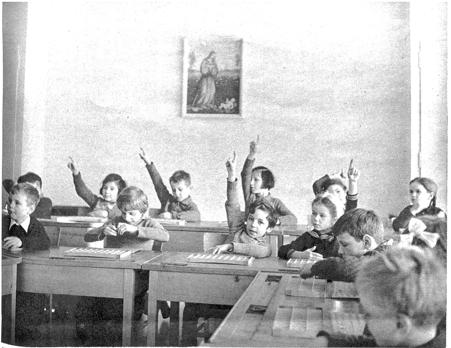
War die Frage zu leicht? Nein, aber die Kinder wissen ganz einfach alles, und sie halten auch gar nicht hinter dem Berge mit ihrer Wissenschaft.