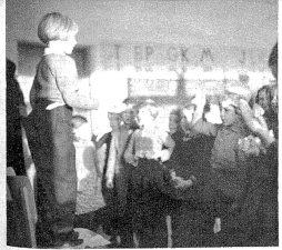
Do re mi fa sol — ja, da singt man nun wirklich — nach Handzeichen singt man hier!