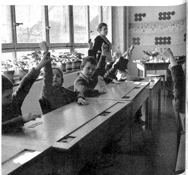
Immer noch Rechnen? oder schon wieder? Keine Angst, das Singen kommt auch an die Reihe, und im übrigen ist es ein Vergnügen, das Rechnen mit diesen Plättchen.