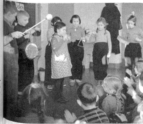
Strawinsky! Ein indischer Tempeltanz! So hört es zwar, zugegeben, aber auch das ist eine rhythmische Übung beim Gesang.