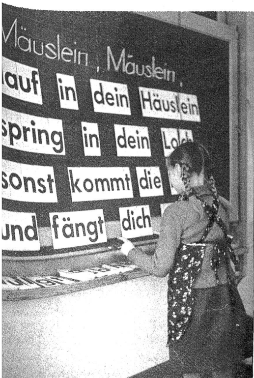
Ein Mädchen, das keine Angst hat vor Mäusen? Gewiss, es scheint, dass es das nun auch schon gibt.