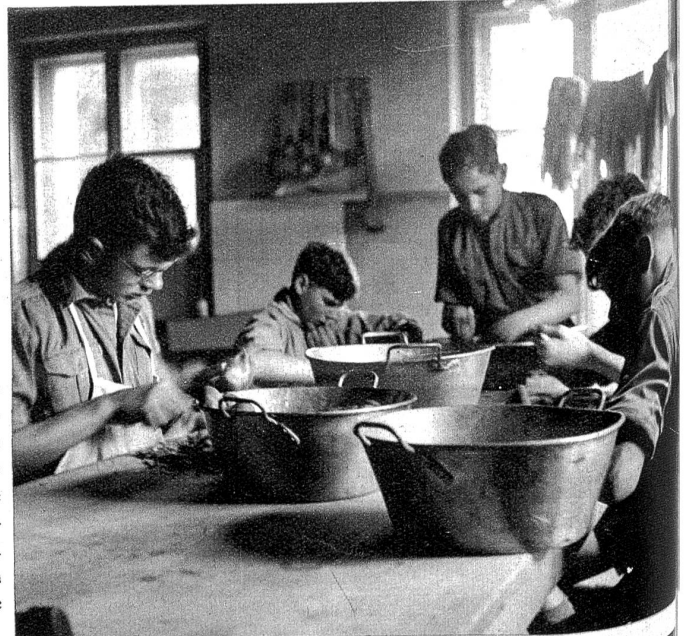
Die Lagerküche wird selbstverständlich von Pfadern selber geführt. Hier „übt“ sich eine Kochspezialistengruppe im Rüsten; denn wenn die Kameraden hungrig von ihren Übungen heimkehren, müssen die dampfenden Schüsseln auf dem Tische stehen.