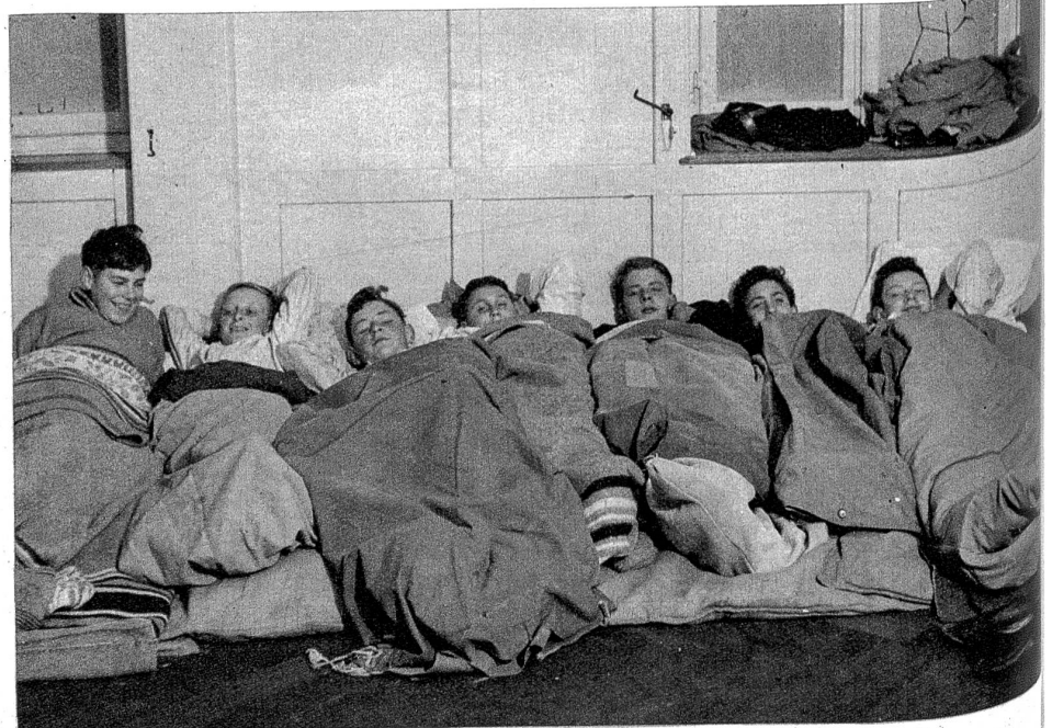
Nachtruhe. Nach des Tages anstrengender Arbeit schläft man auch auf dem Strohsack herrlich.