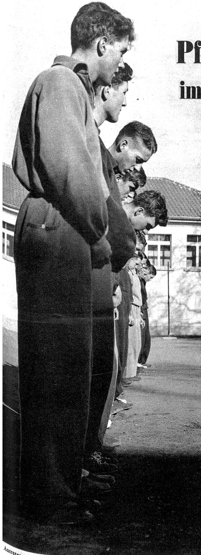
Antreten zum Frühturnen!