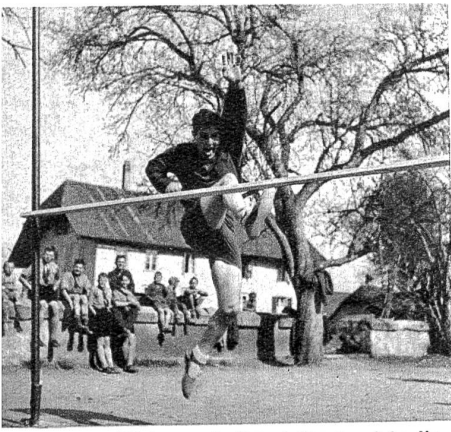
Hochsprung. Nicht gerade formvollendet sieht dieser Sprung aus, aber auch hier macht die Übung den Meister.