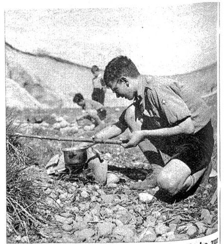
Nicht immer steht den Pfadern eine Küche zur Verfügung. Aber man weiss sich auch mit den einfachsten Mitteln zu helfen, um eine gute Suppe zu brauen.