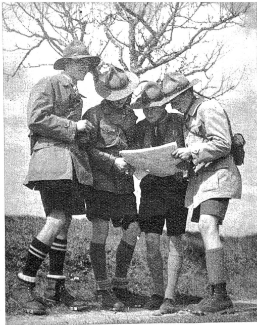
Mit Karte und Kompass geht es durch das Land. Hier steht ein Grüppchen, das seinen Standort feststellen muß, was natürlich für einen geübten Pfader keine Schwierigkeiten bietet.