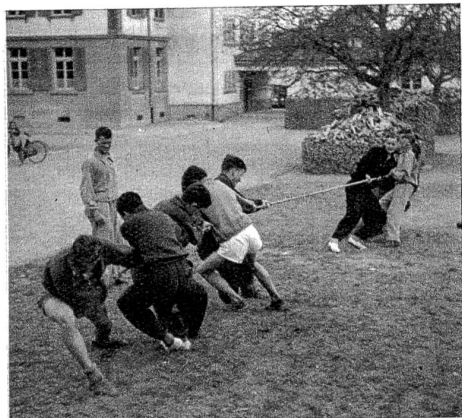
Seilziehen. Der Mann am Tauende wehrt sich verbissen gegen die feurigen Angriffe der Gegenseite.