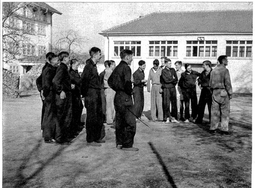
Aufmerksam verfolgt man die Anleitungen des Vorturners.