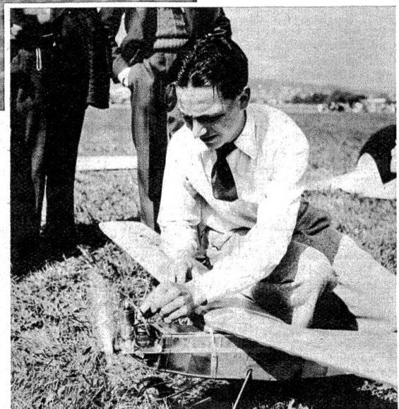
Dieser Einzwölfstel-PS-Motor hat die Aufgabe, das Flugzeug vom Boden auf in die Höhe zu führen. Nach einer gewissen Zeit setzt die motorisierte Antriebskraft aus — und das Flugmodell bleibt dem freien Spiel der Windströmungen überlassen.