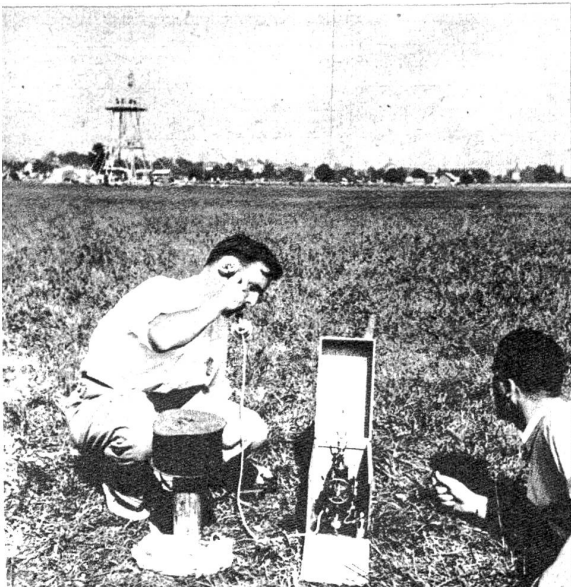
Soeben ist eine Landungsmeldung eingetroffen, die per Feldtelefon zum Turm weitergeleitet und dort durch den Lautsprecher verkündet wird.