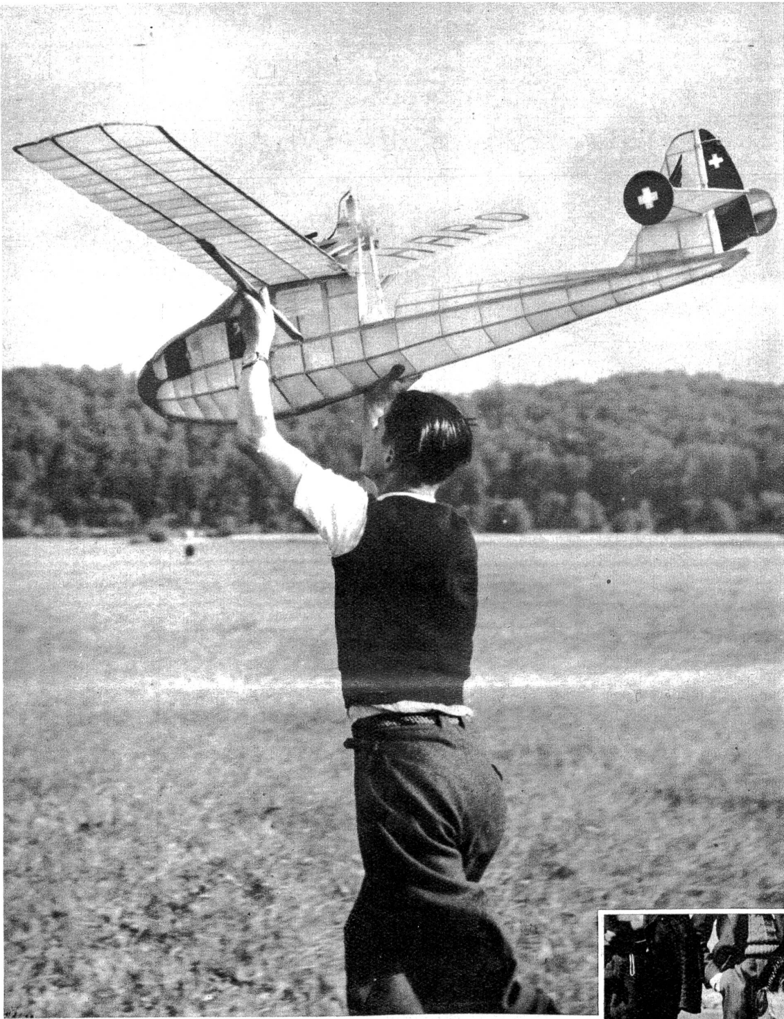
Handstart eines prächtigen Flugmodells mit Benzinmotor am nationalen Flugmodell-Wettbewerb in Solothurn