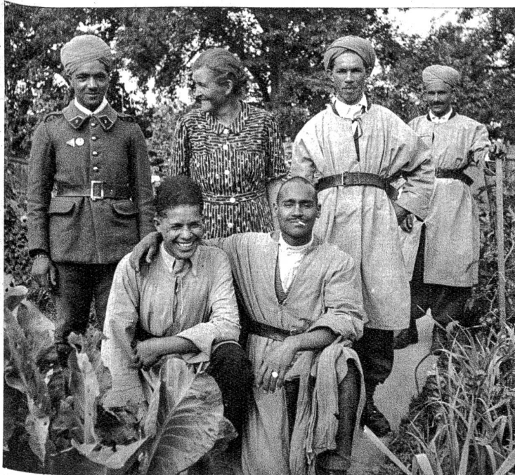
Eine Gruppe von Spahis in ihren gelben Reitermänteln, in der Mitte ihre „Pensionsmutter“, der sie wie aufs Kommando gehorchten. Es sind meist fröhliche liebenswürdige Gesellen, die sich recht gut aufführen.