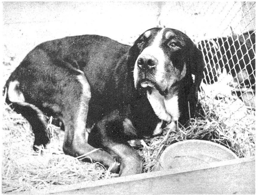
Diese friedliche Visage gehört einem der 45 Kriegshunde, die am Sonntagmorgen überzeugende Proben ihrer vielseitigen Verwendbarkeit in der Armee ablegten.