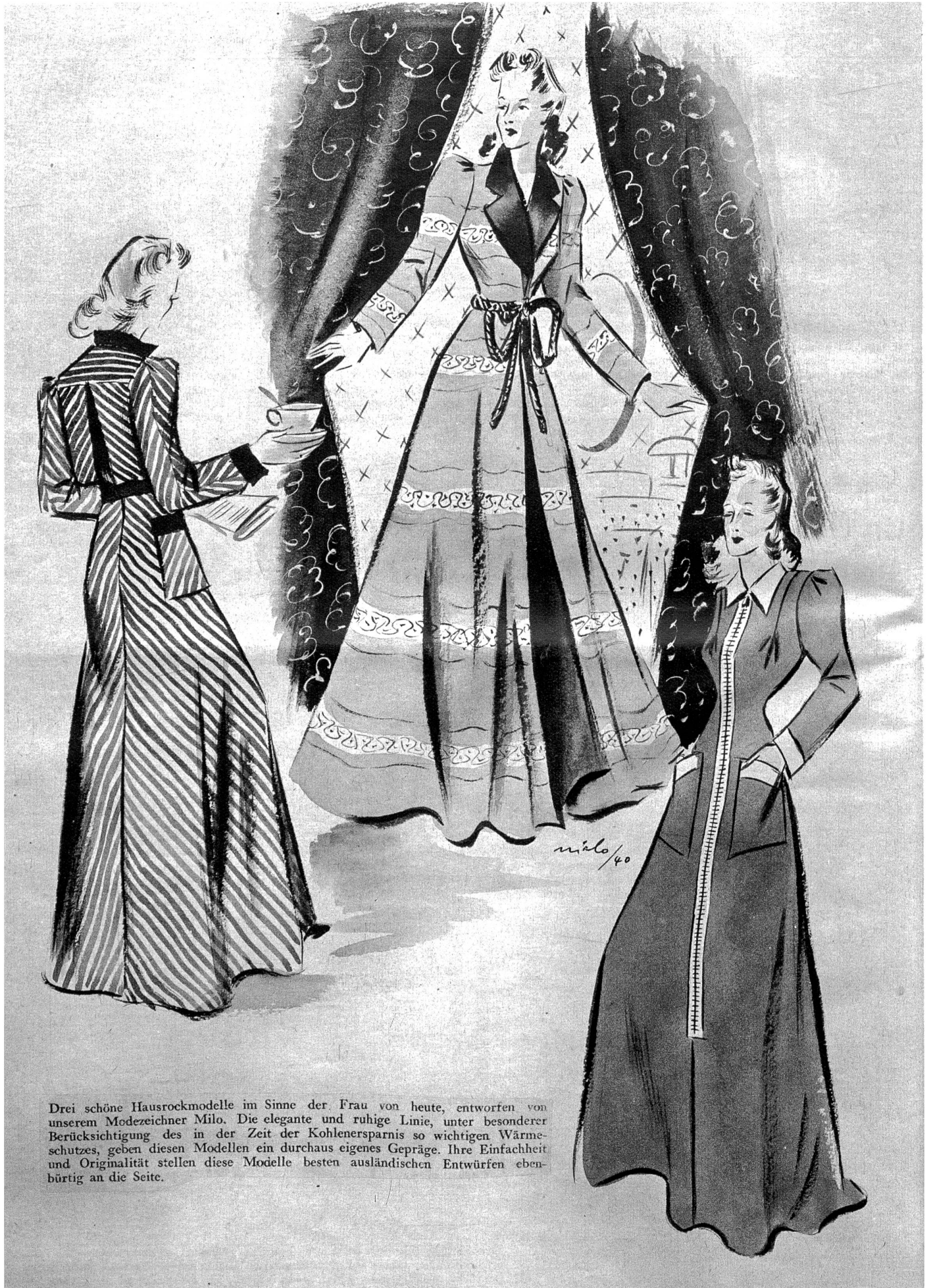
Drei schöne Hausrockmodelle im Sinne der Frau von heute, entworfen von unserem Modezeichner Milo. Die elegante und ruhige Linie, unter besonderer Berücksichtigung des in der Zeit der Kohlenersparnis so wichtigen Wärmeschutzes, geben diesen Modellen ein durchaus eigenes Gepräge. Ihre Einfachheit und Originalität stellen diese Modelle besten ausländischen Entwürfen ebenbürtig an die Seite.