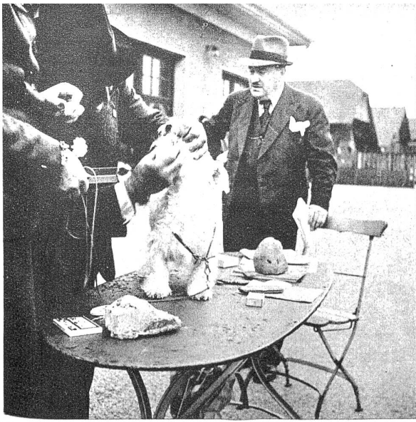
Schön zu sein, ist schon etwas, genügt aber nicht. Ein Hund, ob prämiert oder nicht, muss auch beißen können — also wird das Gebiss ebenfalls einer gründlichen Prüfung unterzogen und „pünktlich“ bewertet.