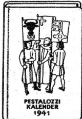
PESTALOZZI KALENDER 1941