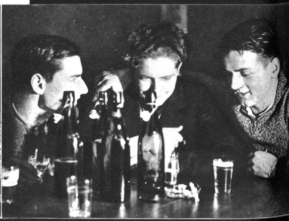
Elfrig wird diskutiert, welcher Wachs am nächsten Clubrennen die grössten Chancen hätte. Es geht dabei recht hitzig zu — da ist das Bier eine willkommene Abkühlung für die erhitzten Temperature