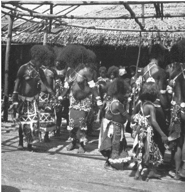
Bilder von einem Tanzfest an der Waropenküste in Nord Neuguinea.

Die Rückreise nach Java und Sumatra führte über Ceram nach Ambon. Mit tiefer Befriedigung denke ich an diese Reise und den Aufenthalt in einem der letzten, noch primitiven Gebiete der Erde.