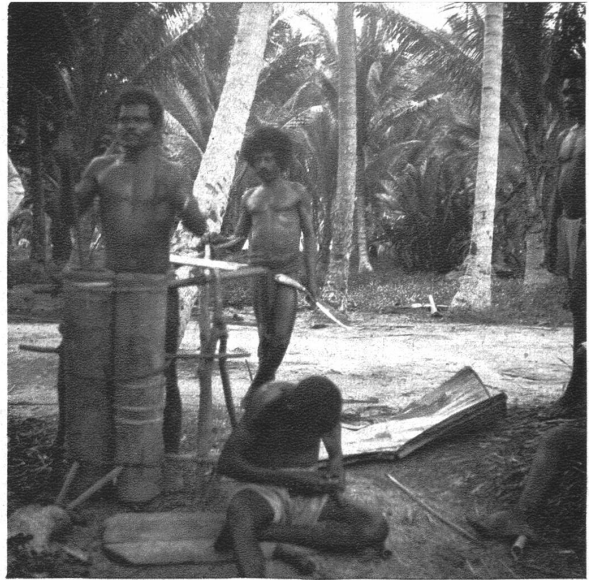
Eingeborner Schmied, mit Blasbalg aus Bambusrohr.

Der Mac-Cluergolf schneidet tief in die Insel ein und schnürt den sogenannten Vogelkopf vom massigen Südtail der Insel ab. Die Landenge, welche den Mac-Cluergolf von der Geelwinkbai im Norden trennt, ist nur gegen 30 km breit. Wir fahren dem nördlichen Ufer entlang in den Golf ein, der hier so breit ist, daß das Südufer unsichtbar bleibt. Einige armselige Küstendörfer werden besucht, die alle auf niedrigen Sandbänken