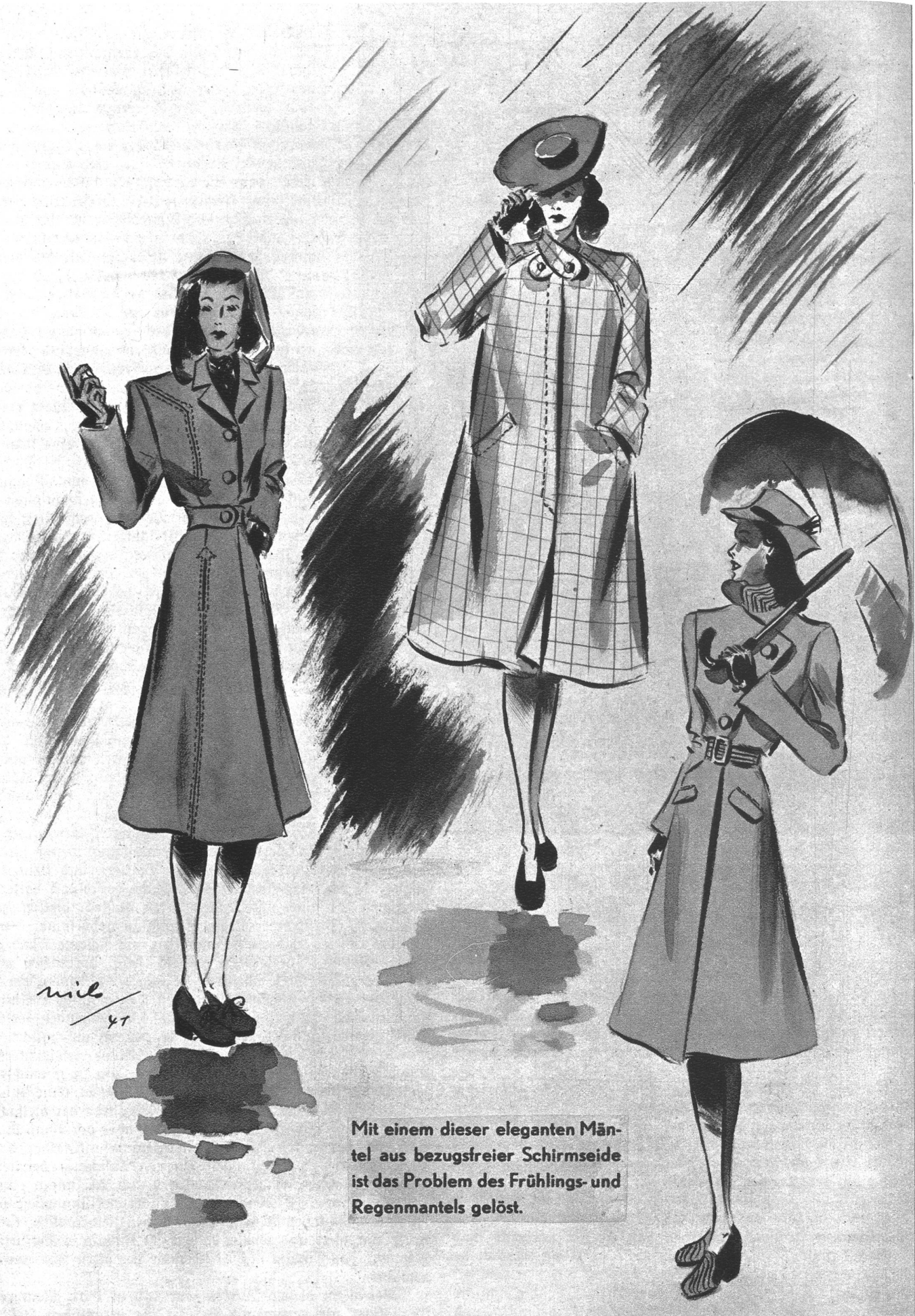
Mit einem dieser eleganten Mäntel aus bezugsfreier Schirmseide ist das Problem des Frühlings- und Regenmantels gelöst.