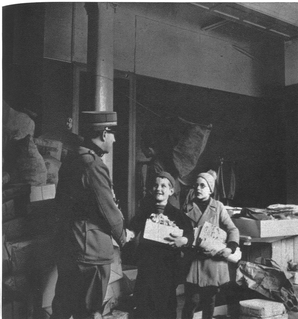
Zwei Schulbuben überbringen freudestrahlend das Sammelergebnis ihrer Klasse und werden vom Leiter der Fürsorgerinnen-Züge für ihren Eifer gelobt, zu neuen Leistungen angespornt.