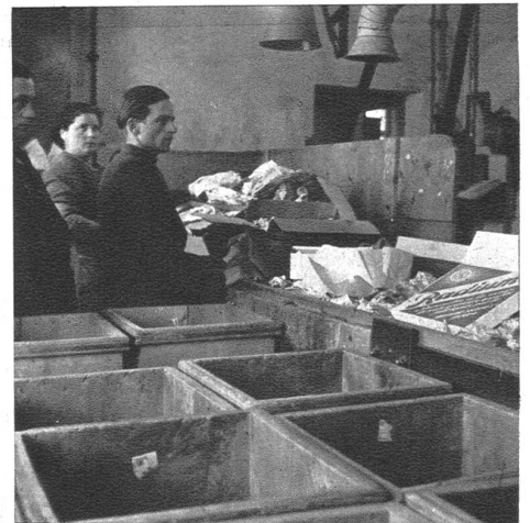
In einem grossen Altstoffsverwertungsbetrieb kommen die Postsendungen auf ein Fliessband. Das Verpackungsmaterial, nach Art und Qualität gesondert, wird von Hand so schnell als möglich in die bereitgestellten Kisten gelegt.