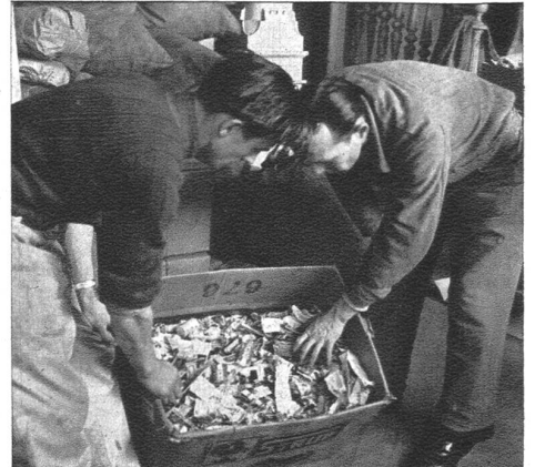
Hier wird vorsortiert, denn nicht alles was glänzt ist Silberpapier. Für Zinntuben bekommt man zwar nur 5 Rappen — aber die Masse macht's.