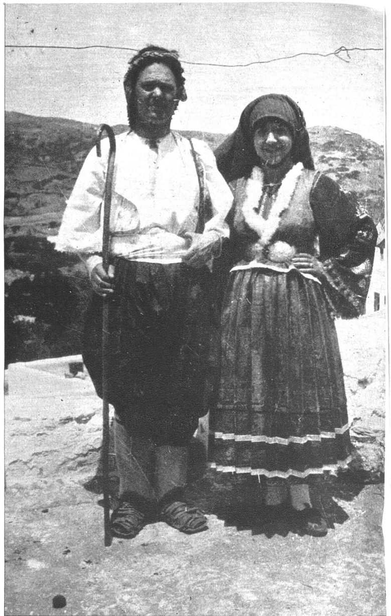
Griechische Volkstypen in der Landestracht.